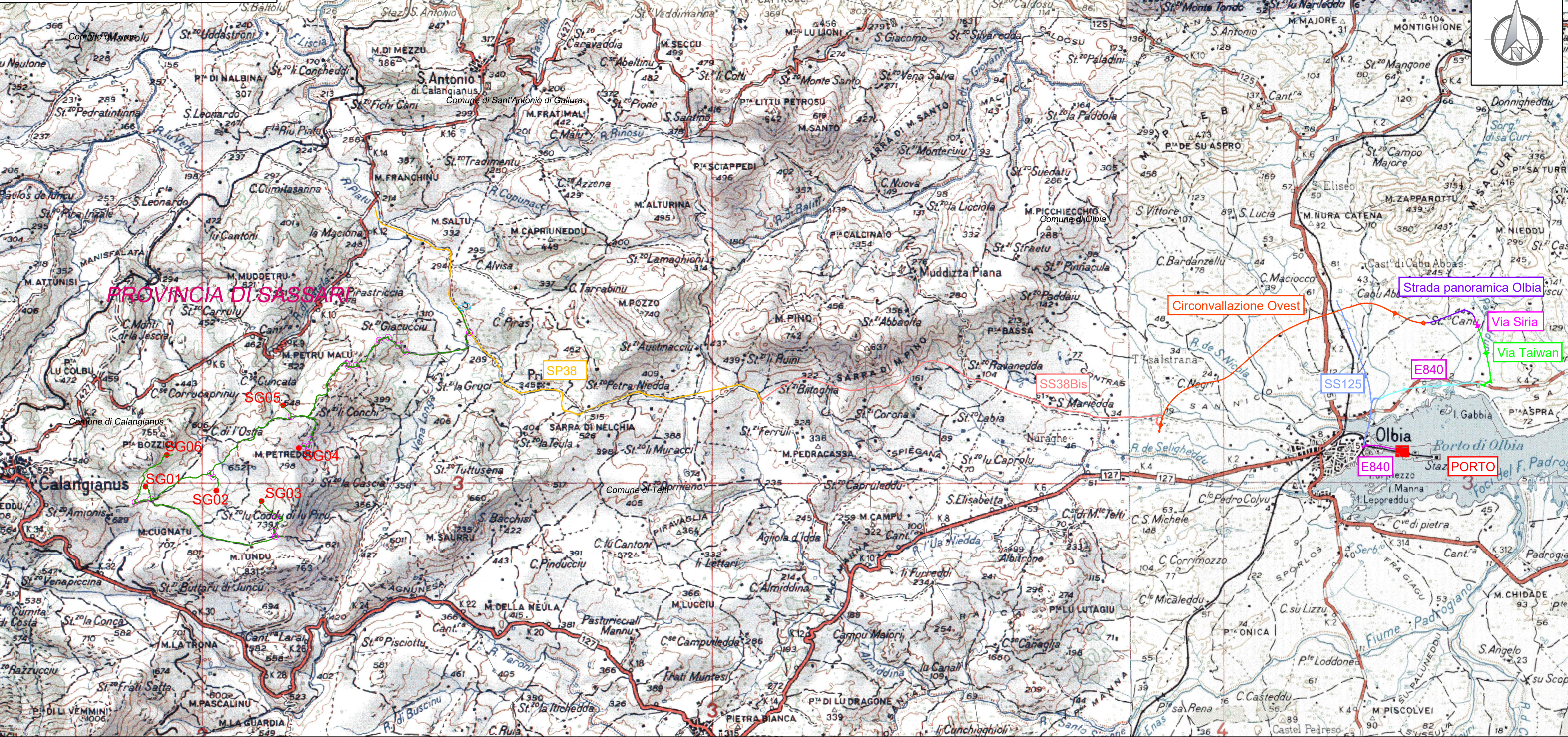
Viabilità esterna - Scala 1:50.000