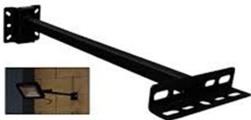
Figura 3 - Tipologico di sistema per installazione faretto su cabina

Illuminazione delle cabine verrà realizzata mediante proiettori LED da 300 W ad alta efficienza installati su bracci posizionati sul prospetto frontale delle cabine.