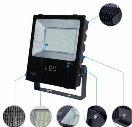
Figura 2 - Tipologico di faretto per illuminazione cabine