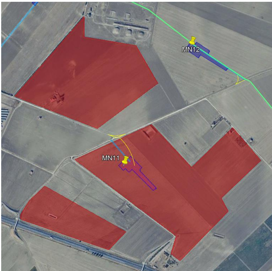
Figura 3 - Dettaglio dell'interferenza