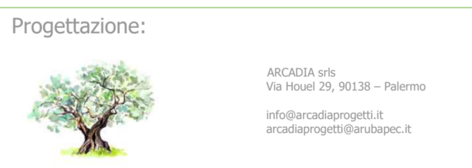
Tavola: CV 3.5

TITOLO: RS06EPD00951 PLANIMETRIA IMPIANTO SU CATASTALE