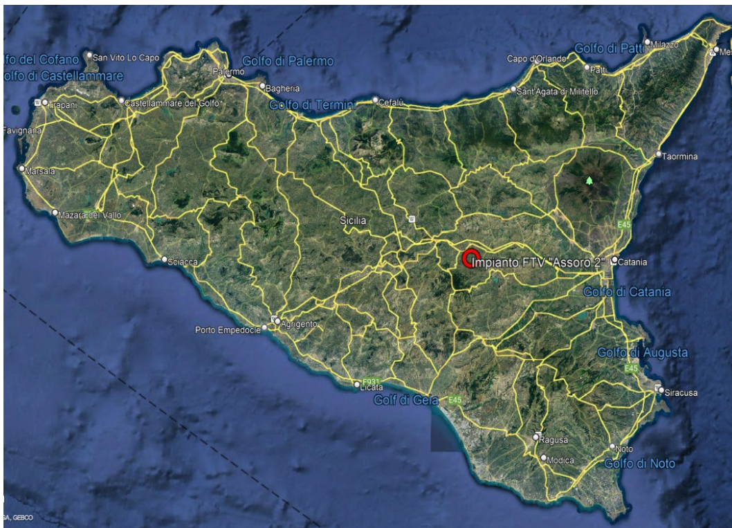
Figura 1 Localizzazione su immagine satellitare

Il nuovo impianto fotovoltaico insisterà, così come accennato precedentemente, su dei lotti di terreno ricadenti nel territorio comunale di Assoro, Aidone ed Enna nella provincia di Enna e di Raddusa in provincia di Catania, nelle località "Milocca, Picirillo, Arginemele, Mandre Tonde, Destricella e San Bartolo".