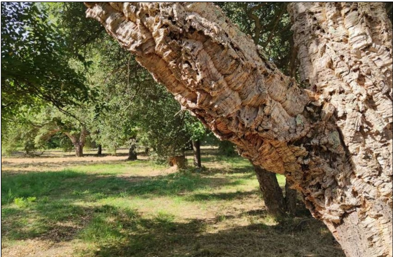
FIGURA 2 – Esempio di Quercus suber L.

In Gallura l'agricoltura è caratterizzata dalla viticoltura e dall'allevamento. Nella viticoltura un ruolo importante ha avuto la selezione e la produzione di vini di qualità, valorizzando le cultivar "vermentino", ora diffusa in molte aree della Sardegna. L'allevamento è stato prevalentemente ovino e bovino in aziende spesso di buone dimensioni, dove insistono gli insediamenti sparsi di notevole interesse paesaggistico. Nel complesso l'agricoltura gode di una discreta salute, favorita da buoni mercati.