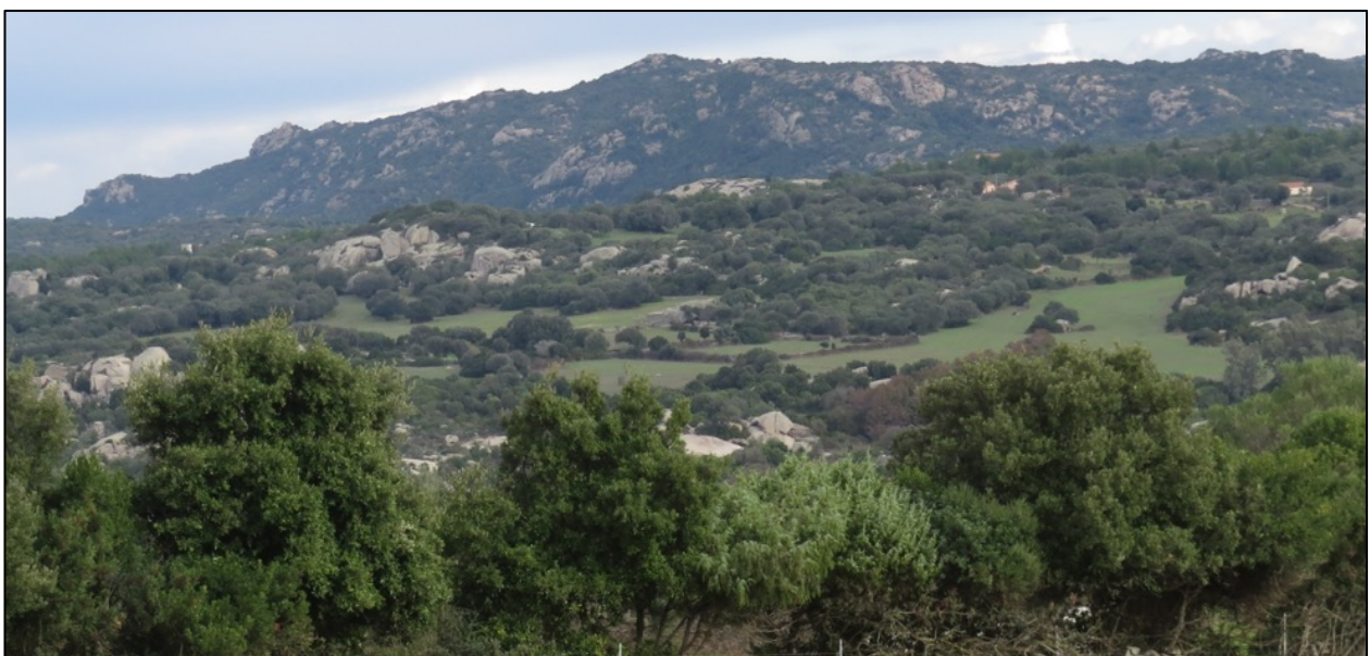
FIGURA 3 – Esempio del sistema agricolo del territorio con presenza di ampi spazi naturali con copertura arboreo-arbustiva

Il solo sistema agricolo è costituito principalmente da prati e pascoli artificiali e secondariamente da colture erbacee rappresentate da seminativi a cereali e da colture foraggere: esse rappresentano la totalità delle colture nei siti di impianto dei 14 aerogeneratori. Le colture arboree come oliveti e vigneti rappresentano una minima parte delle superfici messe a coltura. Piuttosto comuni sono i fondi agricoli temporaneamente incolti e privi di destinazione produttiva, oppure destinati a prati e pascoli artificiali.