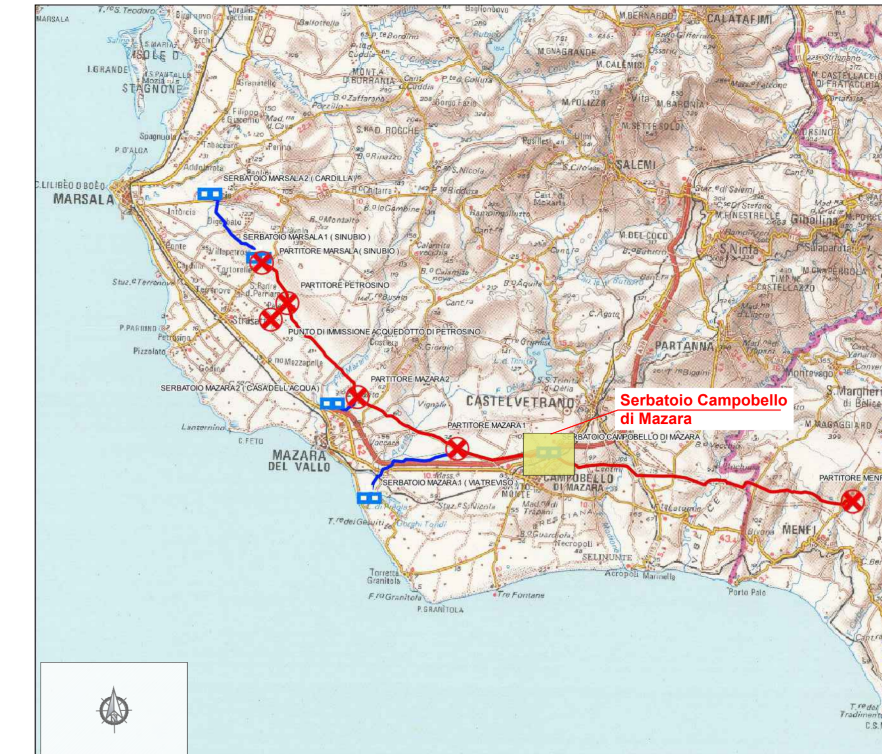
QUADRO DI UNIONE (Stralcio IGM Carta Tecnica Regionale della Sicilia) SCALA 1:250.000