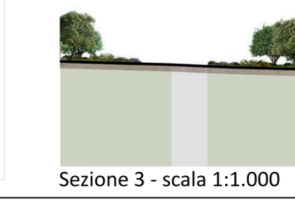
Sezione 3 - scala 1:1.000