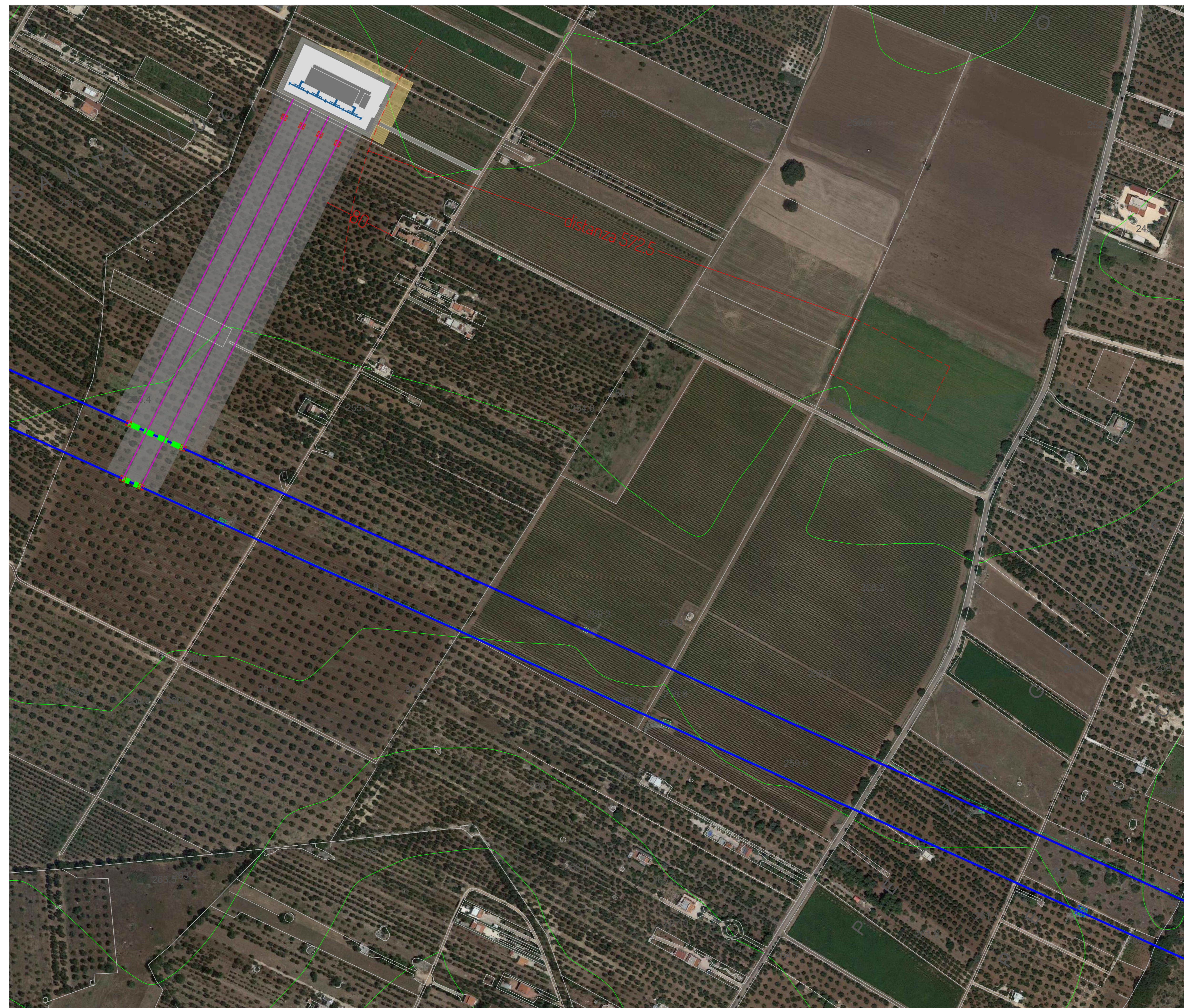
IPOTESI DI UBICAZIONE ALTERNATIVA