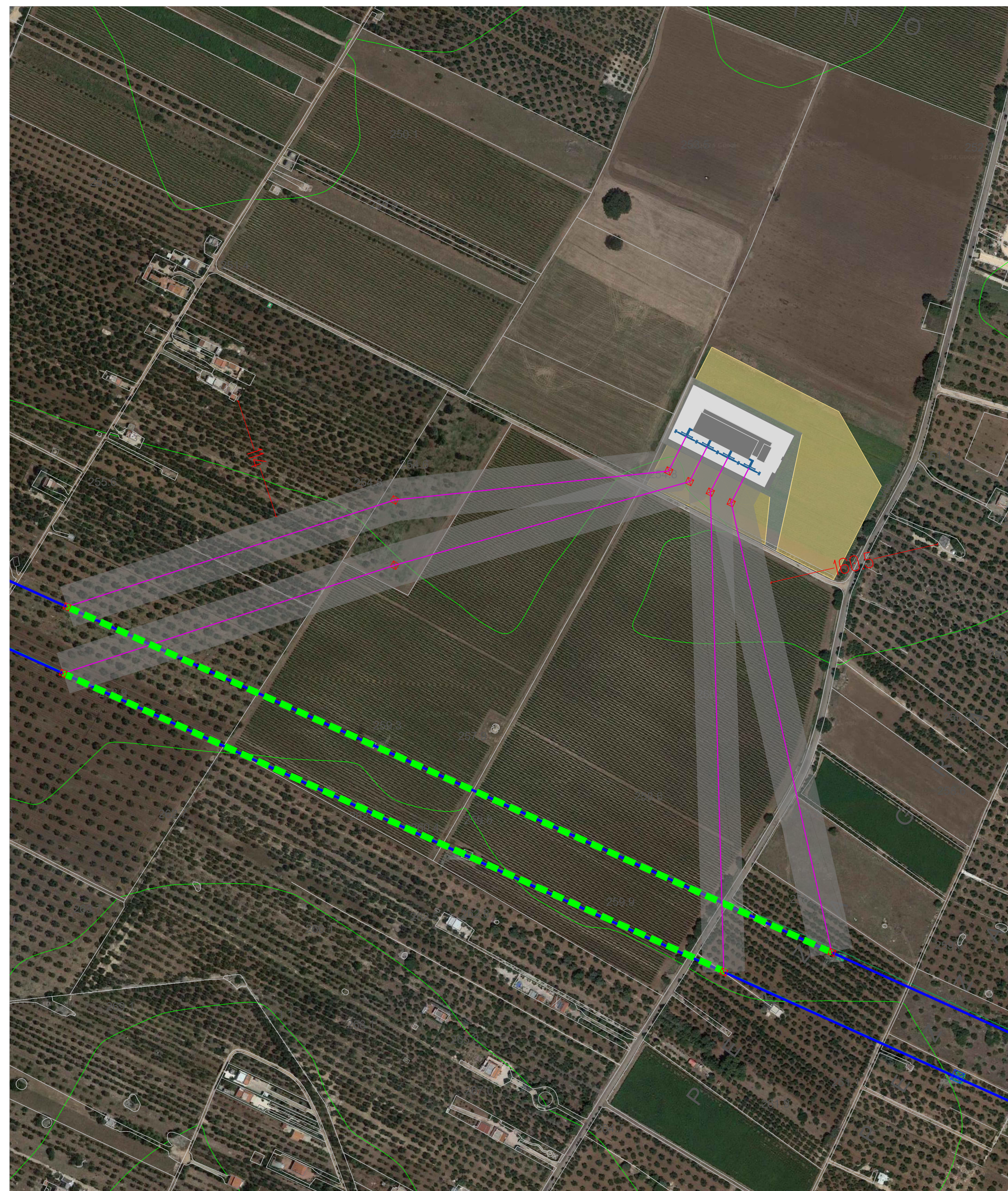
UBICAZIONE DI PROGETTO