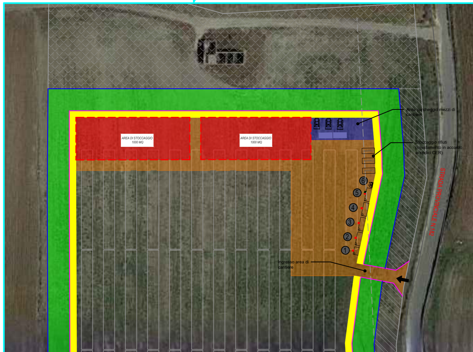
SOVRAPPOSIZIONE AREA DI CANTIERE E LAYOUT FINALE D'IMPIANTO SCALA 1:1.000