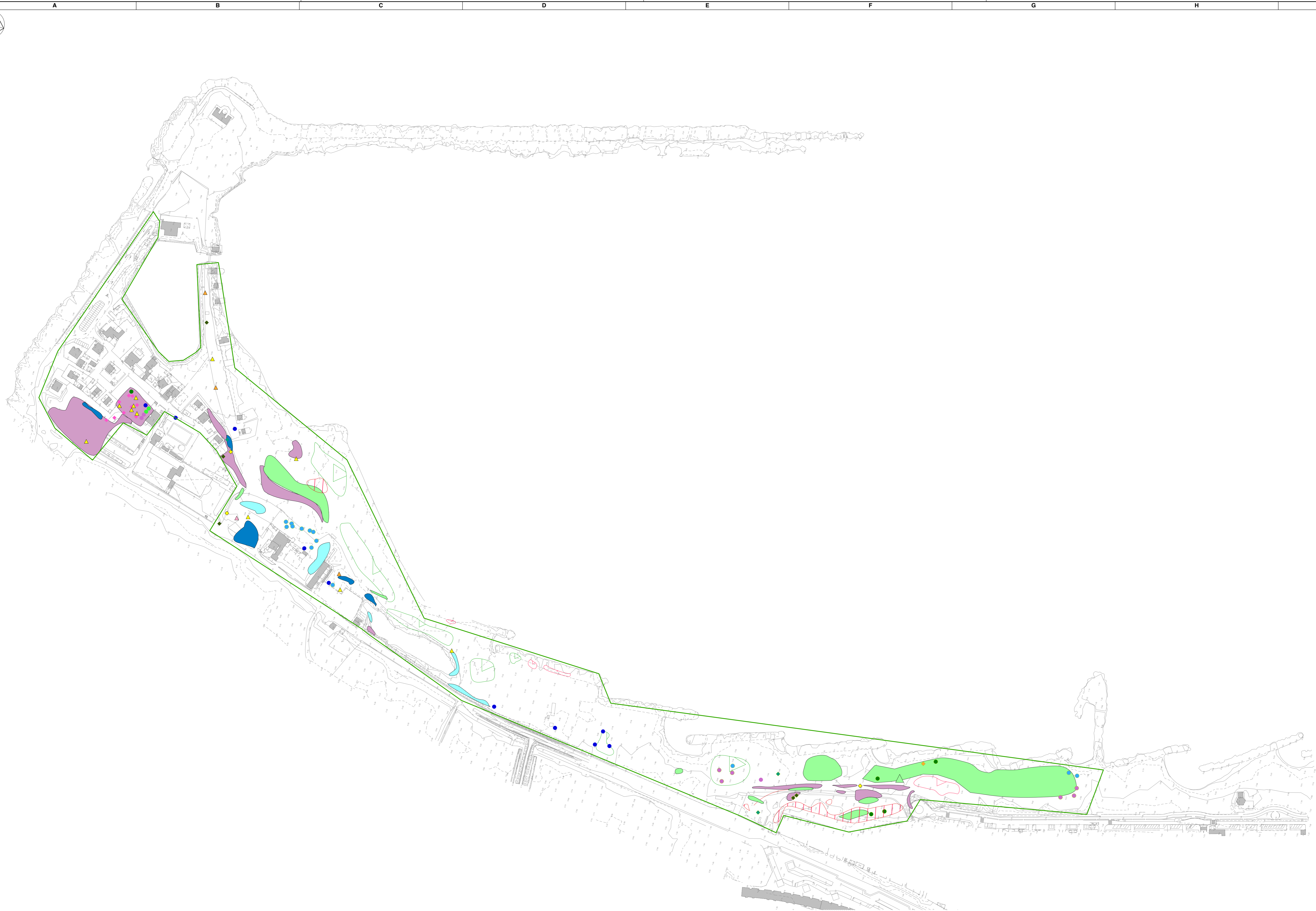
Planimetria generale dello stato della vegetazione (rilievo) scala 1:2.000