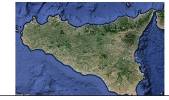
TAVOLA DEGLI HABITAT CORINE BIOTIPES