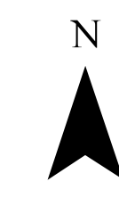
TAVOLA ZONE UMIDE RAMSAR