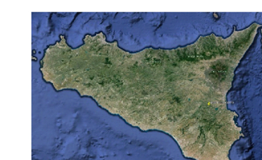
TAVOLA AREE IDONEE D. LGS 199_2021 SU CTR