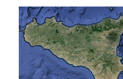
TAVOLA AREE IDONEE D_LGS 199-2021 SU FOTOSATELLITARE