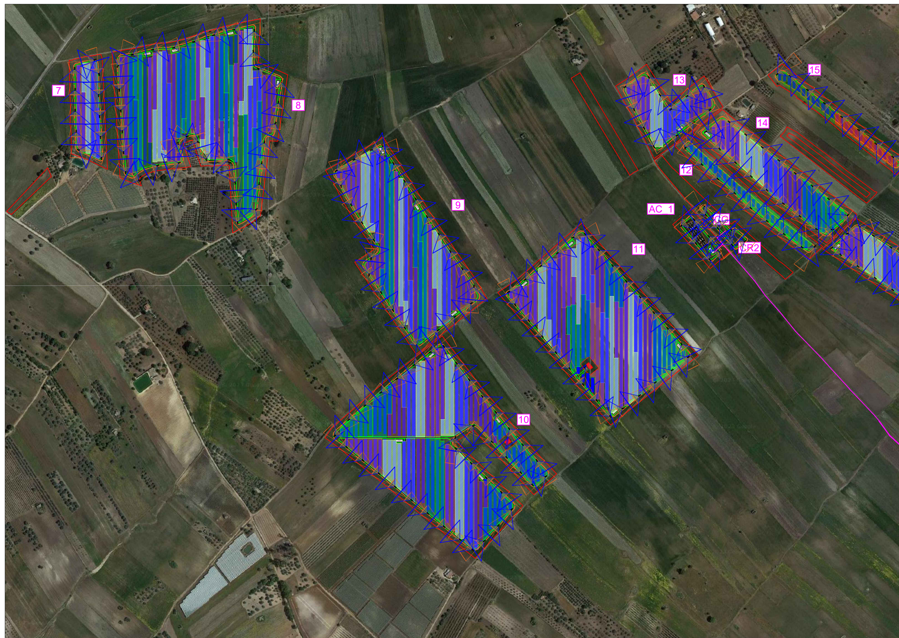
Planimetria videosorveglianza - Scala 1:5.000