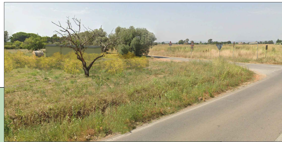
FOTOINSERIMENTO - VISTA DA STRADA STATALE SS1