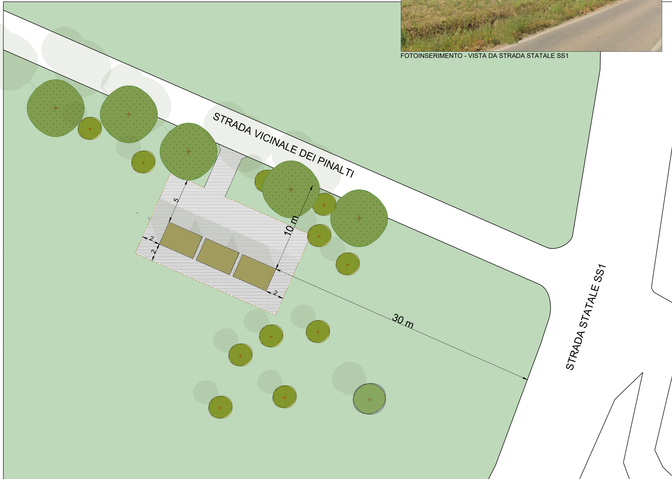
PLANIMETRIA SCALA 1:200