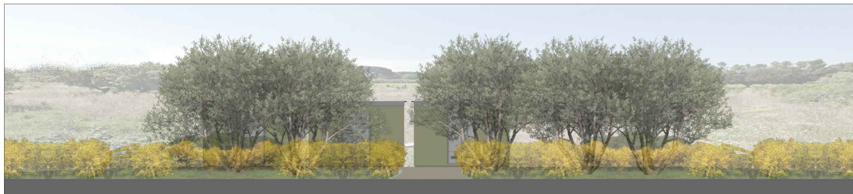
PROSPETTO STRADA VICINALE DEI PINALTI - SCALA 1:100