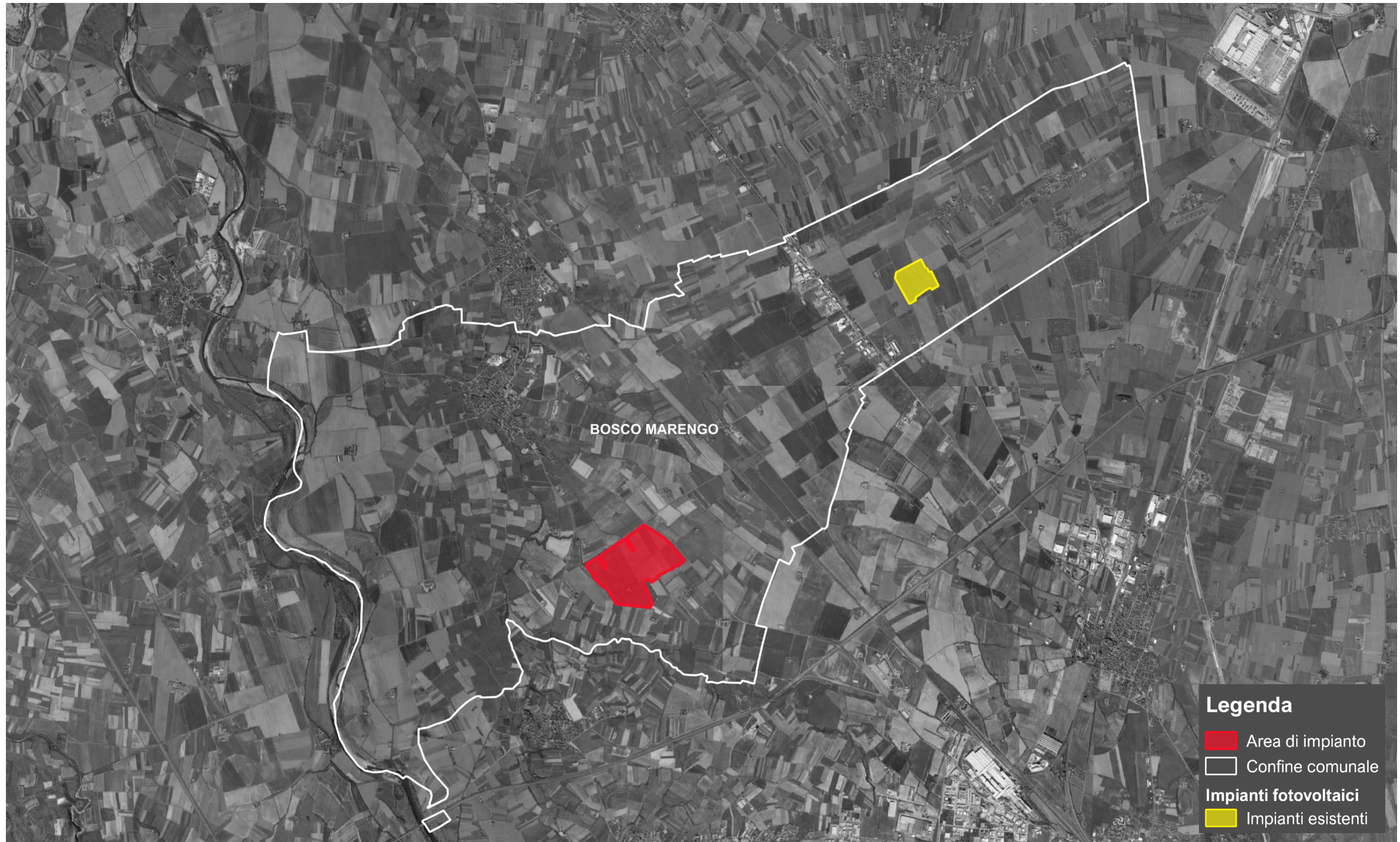
Tavola 1. Localizzazione dell'area di progetto (superficie in rosso ) rispetto agli impianti fotovoltaici "REALIZZATI" (superficie in giallo ), presenti all'interno del confine comunale di Bosco Marengo (perimetro in bianco ). Non si rilevano impianti "in autorizzazione" o "autorizzati" all'interno dell'areale considerato.