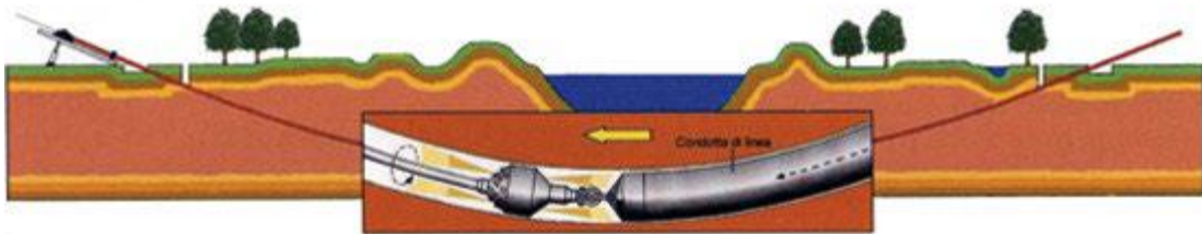
Figura 4. Tecnologia di trivellazione orizzontale controllata (TOC)