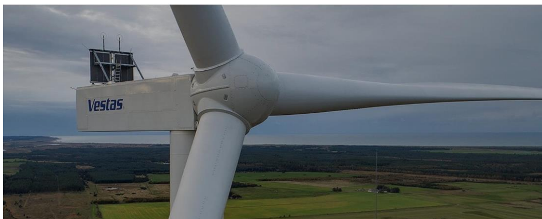
Figure 3. Tipico aerogeneratore Vestas V162-7,2 MW

La turbina, di norma, è equipaggiata, in accordo alle disposizioni dell'ENAC (Ente Nazionale per l'Aviazione Civile), con un sistema di segnalazione notturna per la