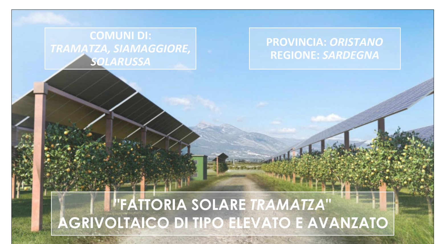
"FATTORIA SOLARE TRAMATZA" AGRIVOLTAICO DI TIPO ELEVATO E AVANZATO

COMUNI DI: TRAMATZA, SIAMAGGIORE, SOLARUSSA PROVINCIA: ORISTANO REGIONE: SARDEGNA