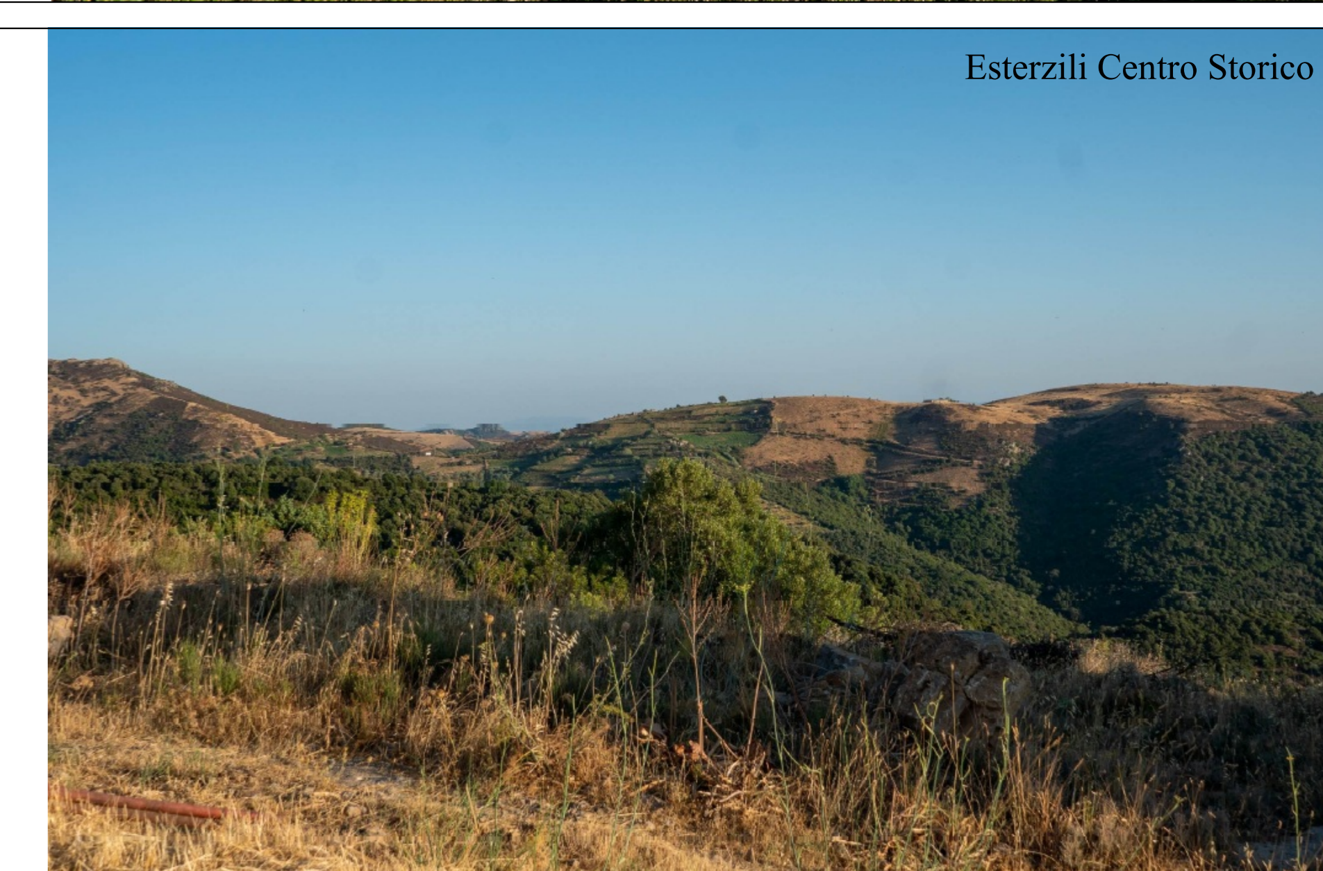
Esterzili Centro Storico