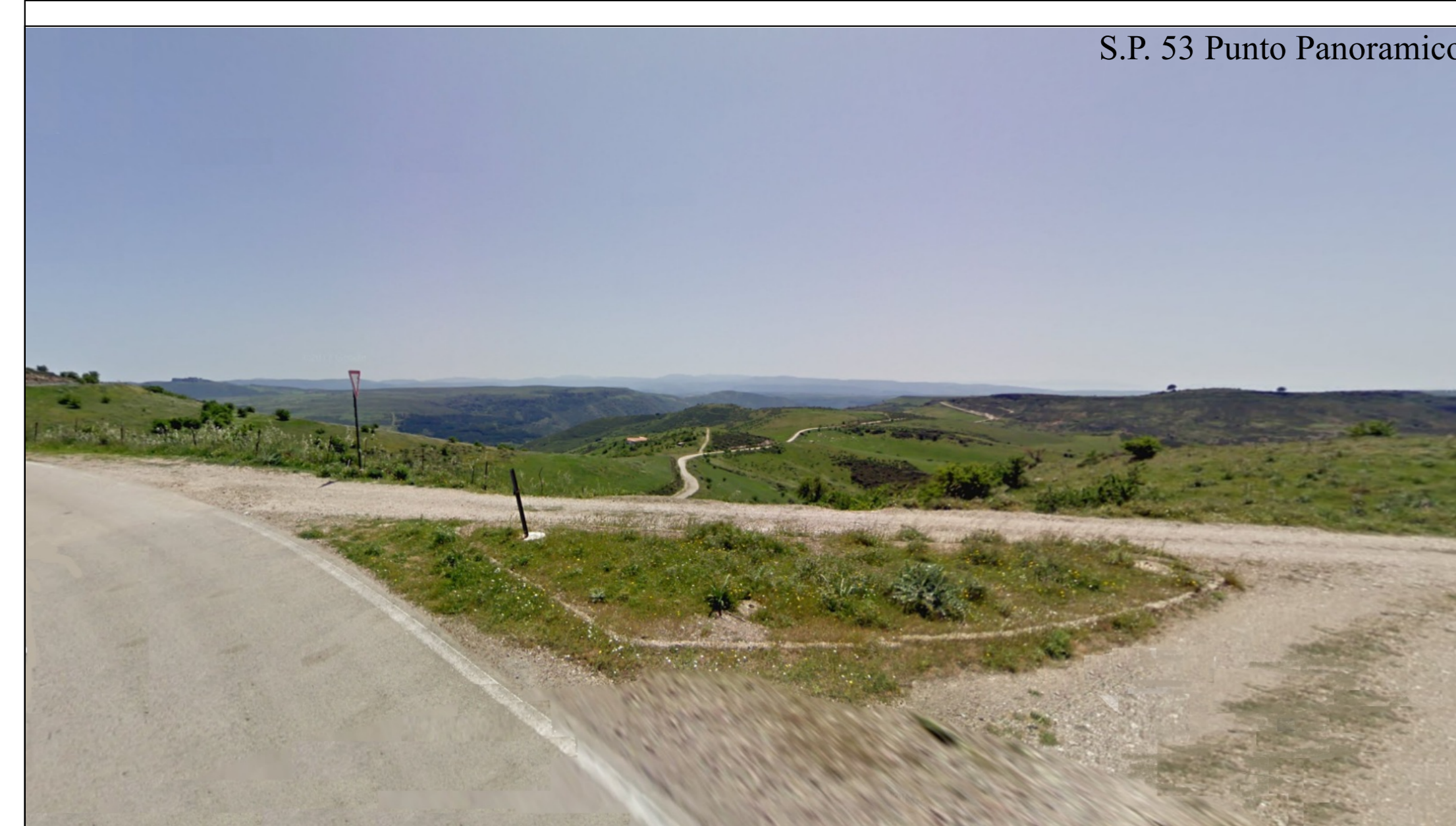
S.P. 53 Punto Panoramico