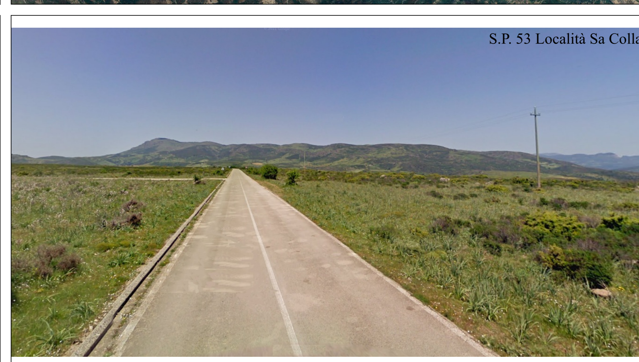
S.P. 53 Località Sa Colla