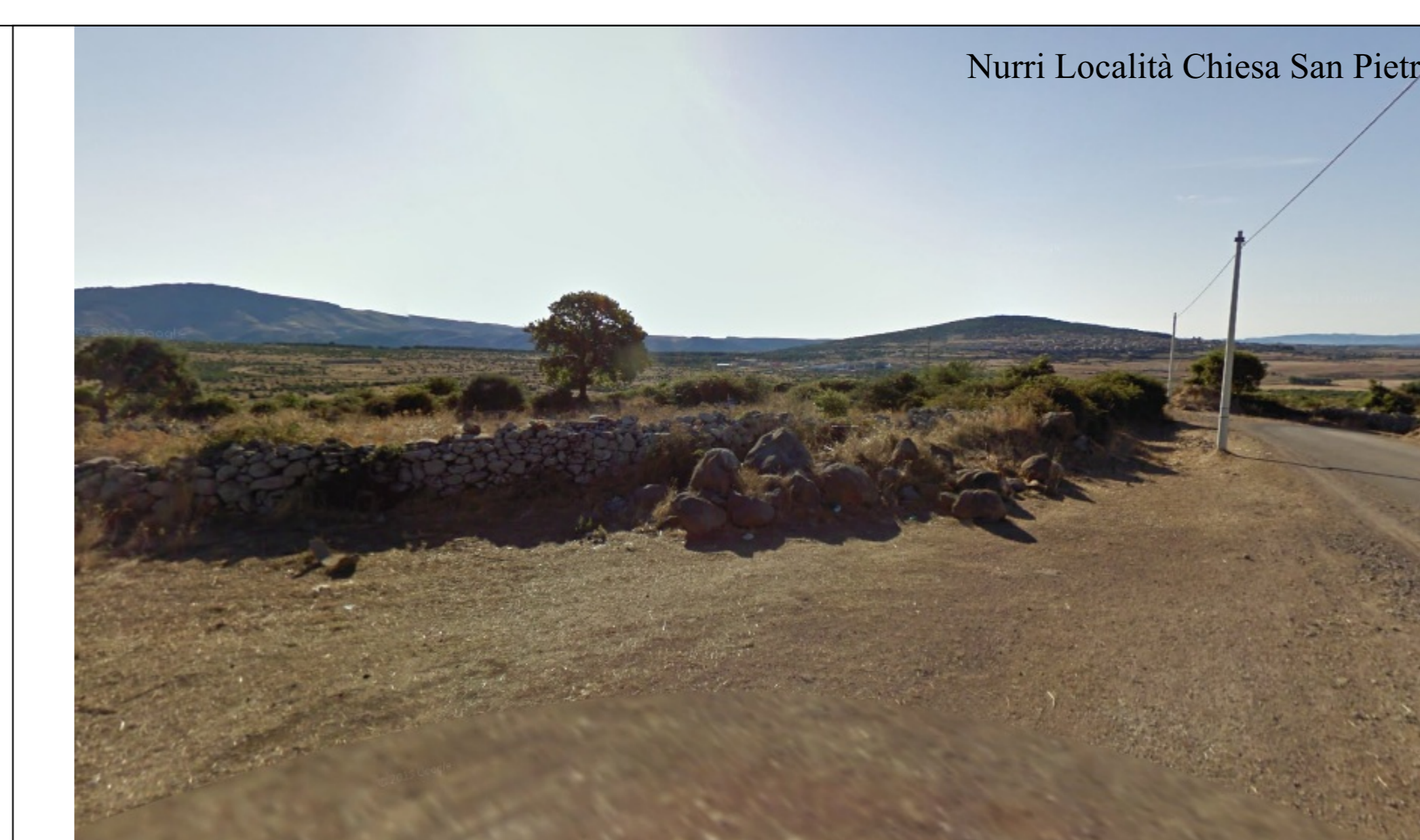
Nurri Località Chiesa San Pietro