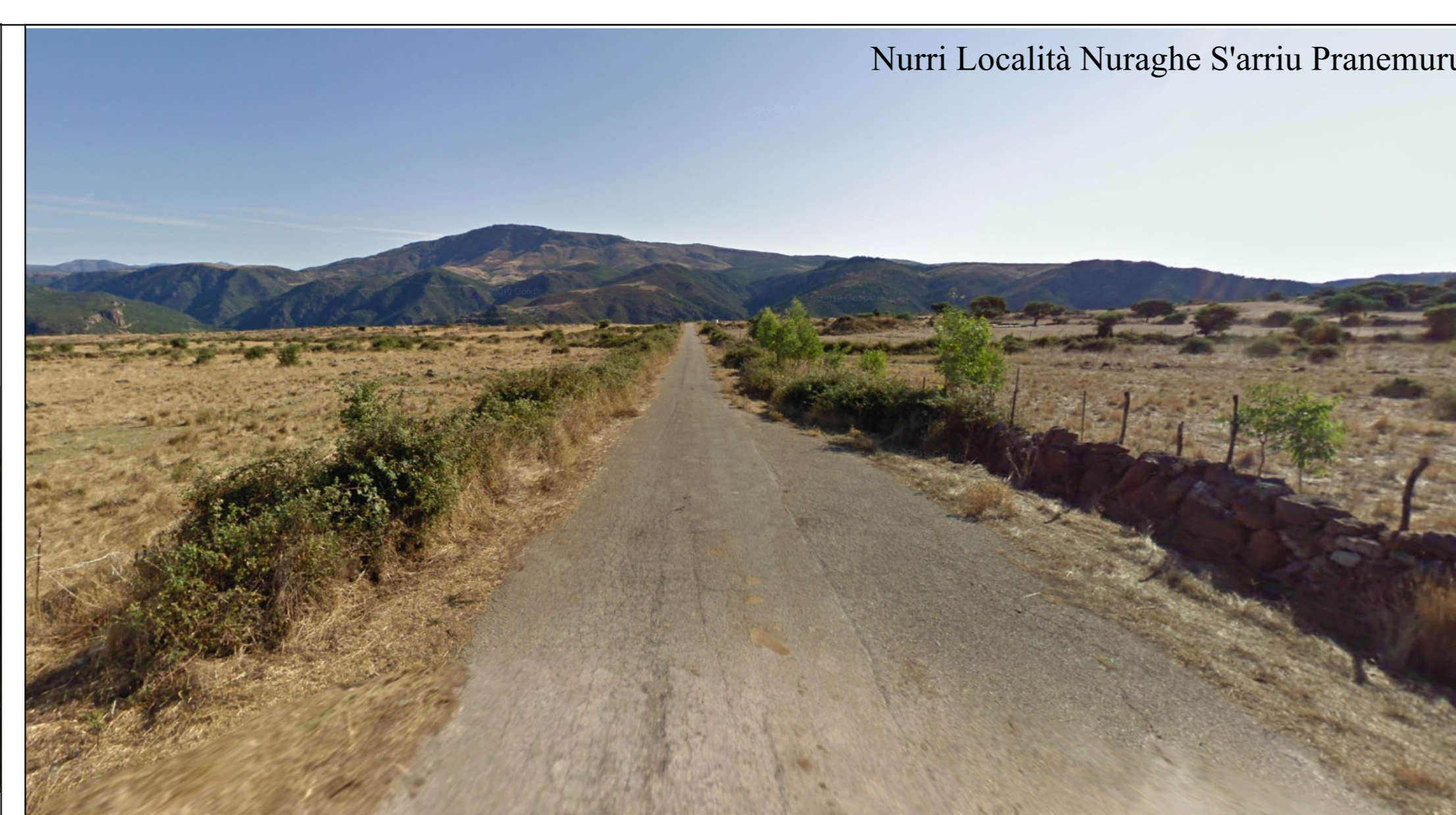
Nurri Località Nuraghe S'arriu Pranemuru