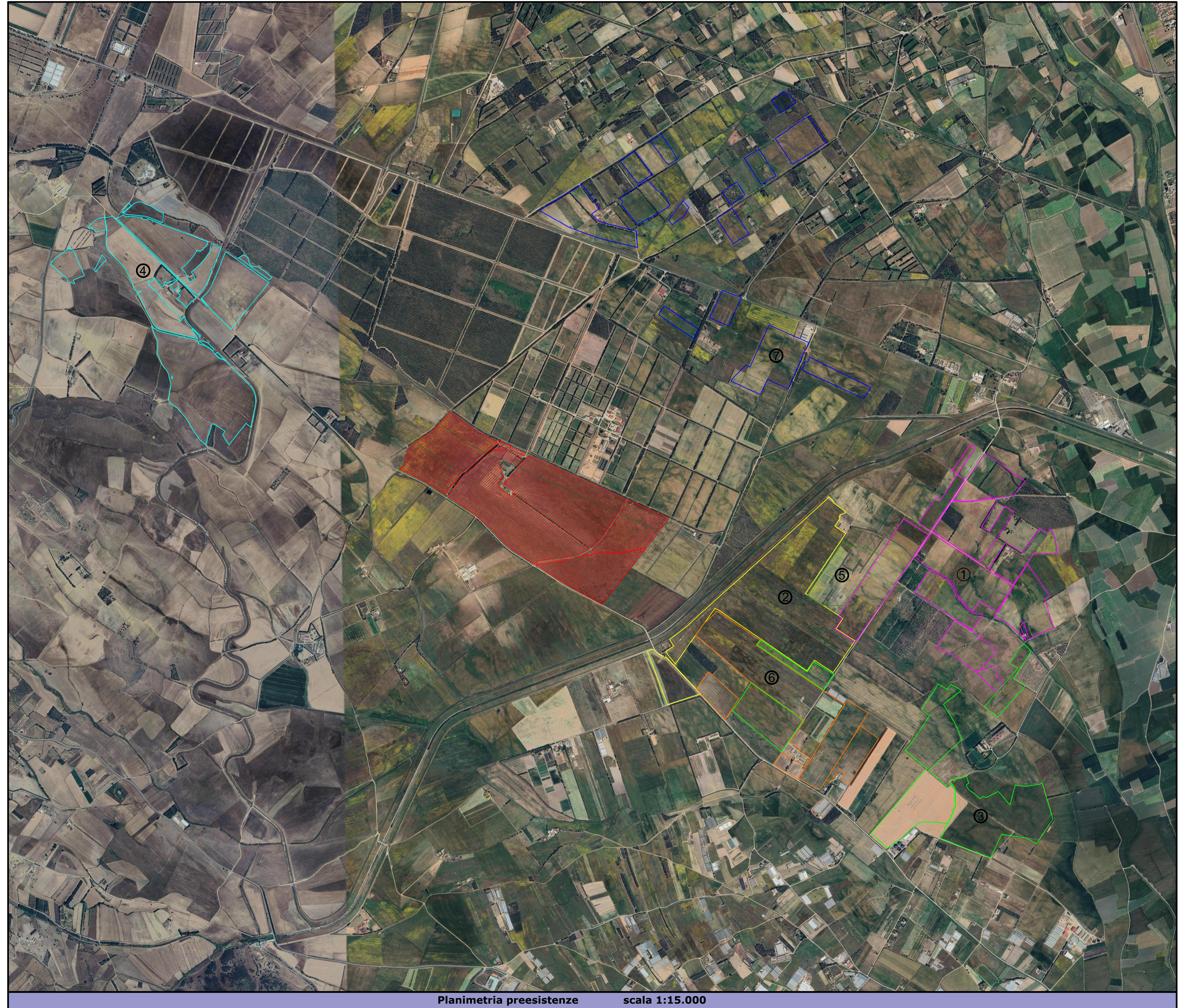
Planimetria preesistenze scala 1:15.000