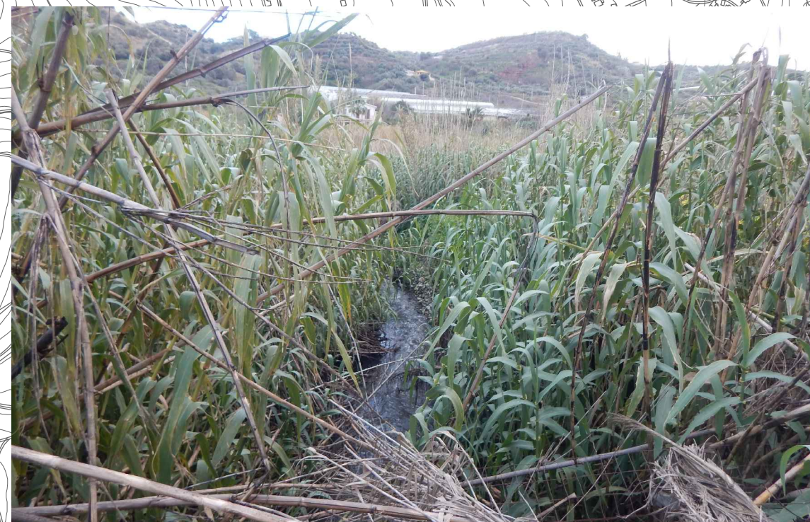
VEG.7 - Fasce ripariali Foto 6