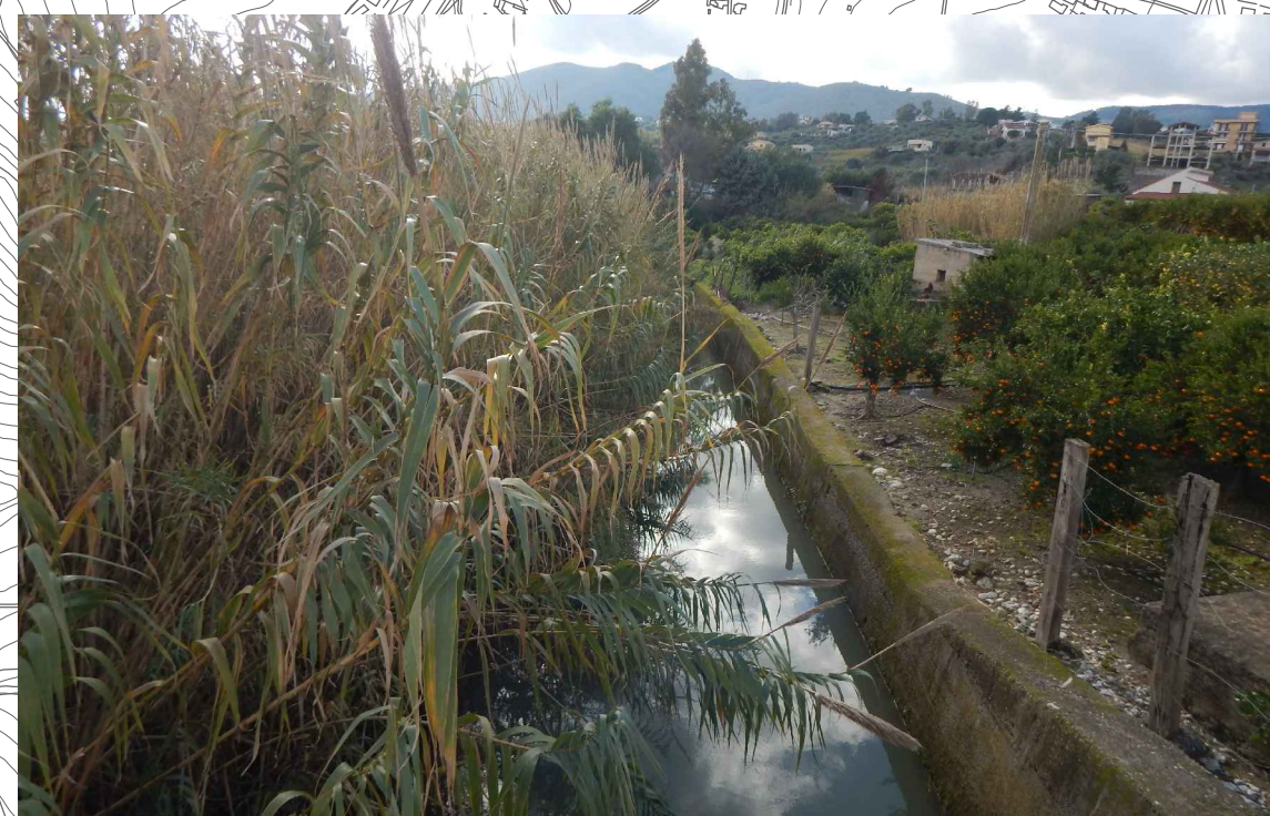
VEG.10 - Fasce ripariali Foto 7