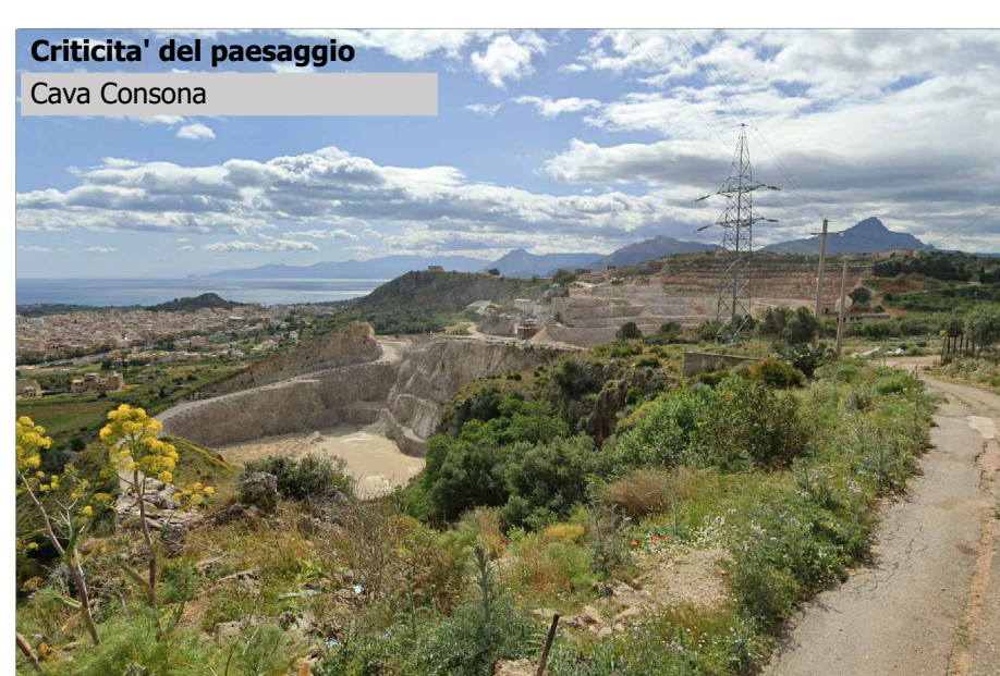
Criticita' del paesaggio Cava Consona