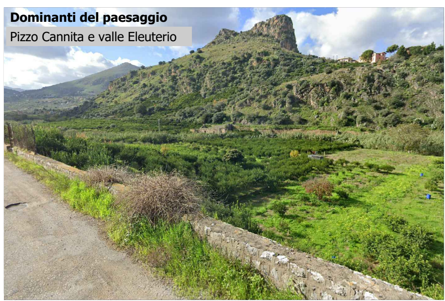
Dominanti del paesaggio Pizzo Cannita e valle Eleuterio