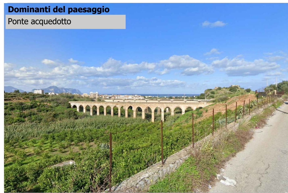
Dominanti del paesaggio Ponte acquedotto