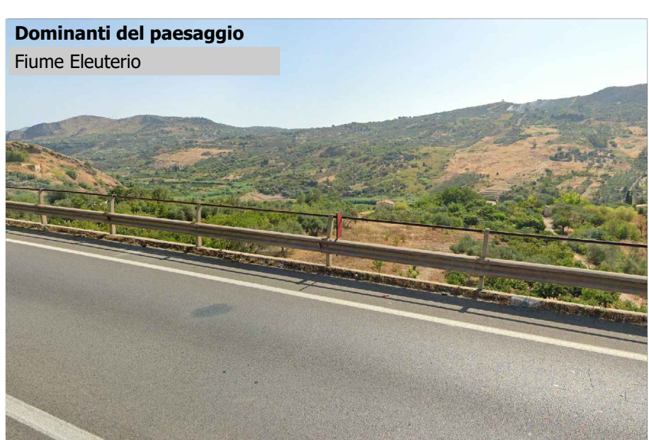
Dominanti del paesaggio Fiume Eleuterio