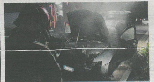
L'auto distrutta dal rogo a Vasto

Auto in fiamme Torna la paura del piromane