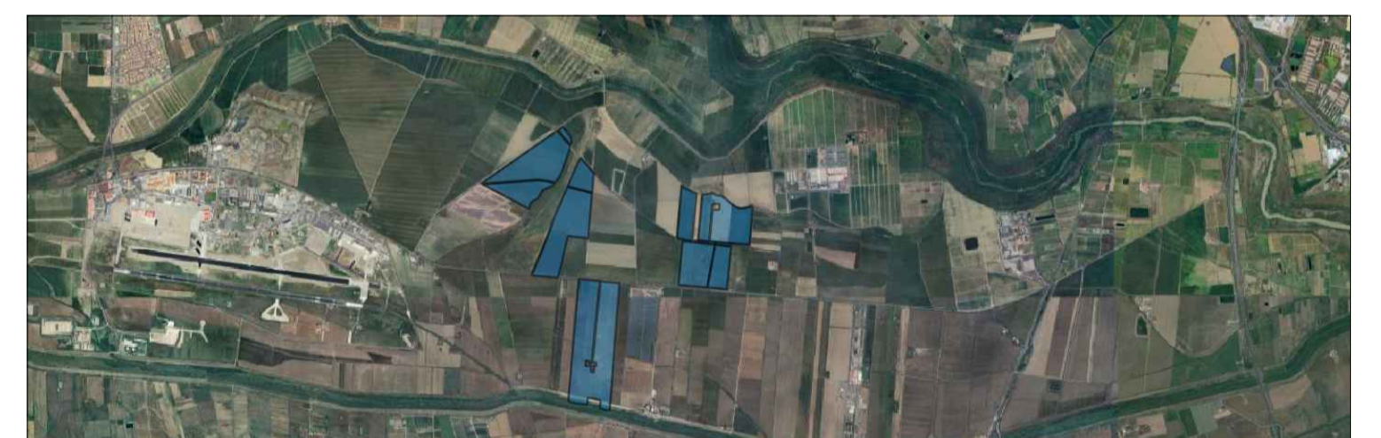
Elaborato : Layout impianto fotovoltaico su CTR (Campo 3)

Realizzazione di parco fotovoltaico della potenza complessiva di 98.89 MW e relativo cavidotto da realizzarsi nel territorio del comune di Catania, c/da Sigona