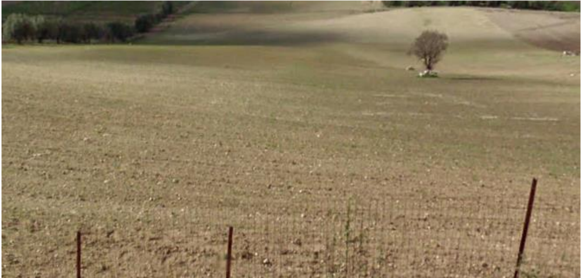
Foto 1 - Area circostante l'impianto - Visuale panoramica