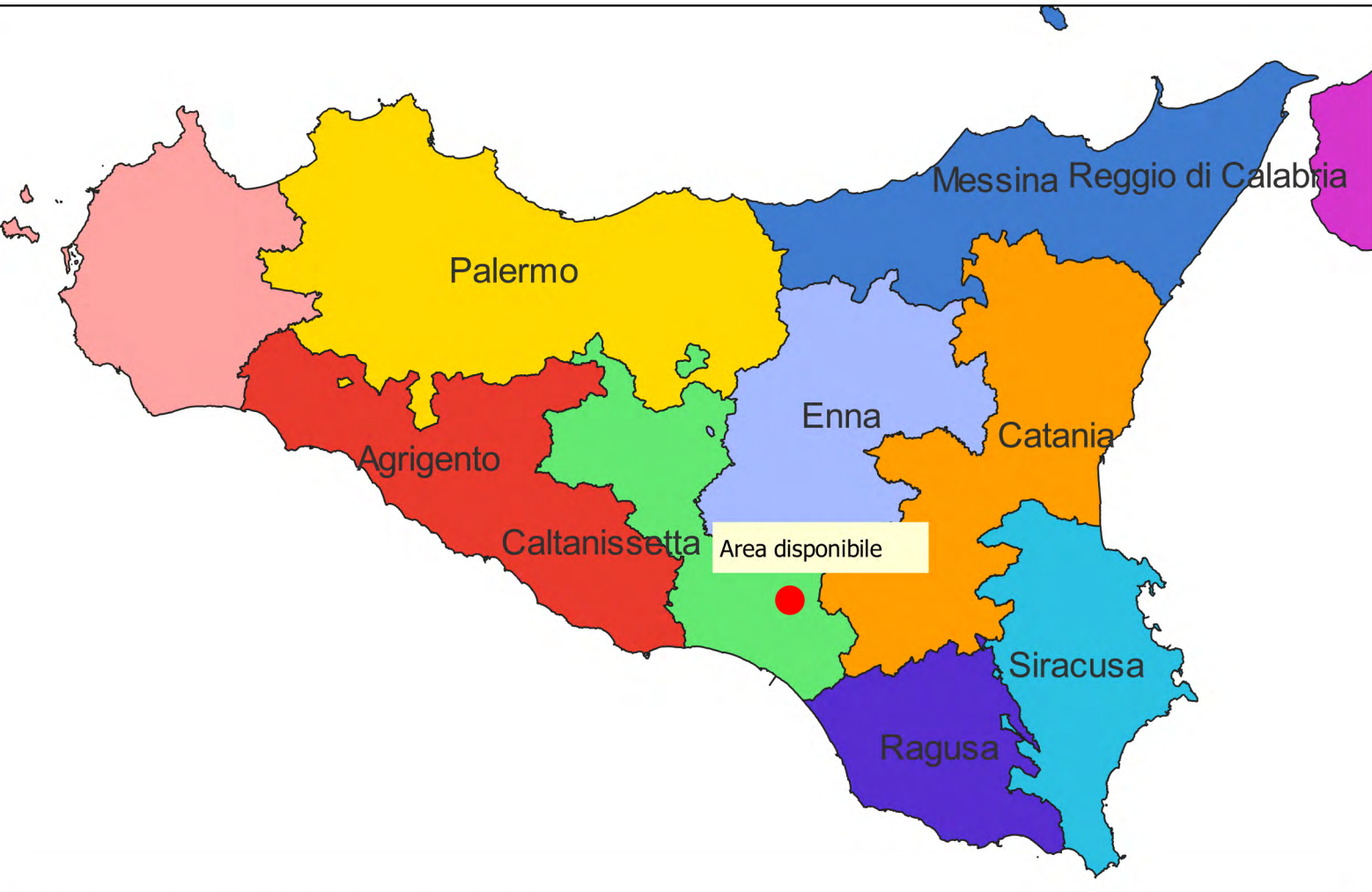
INQUADRAMENTO TERRITORIALE - SCALA 1:1.500.000