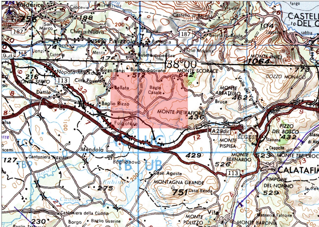
Figura 1 - Inquadramento territoriale del progetto (1/2)

In Figura 1 e Figura 2 è mostrato un inquadramento territoriale del progetto.