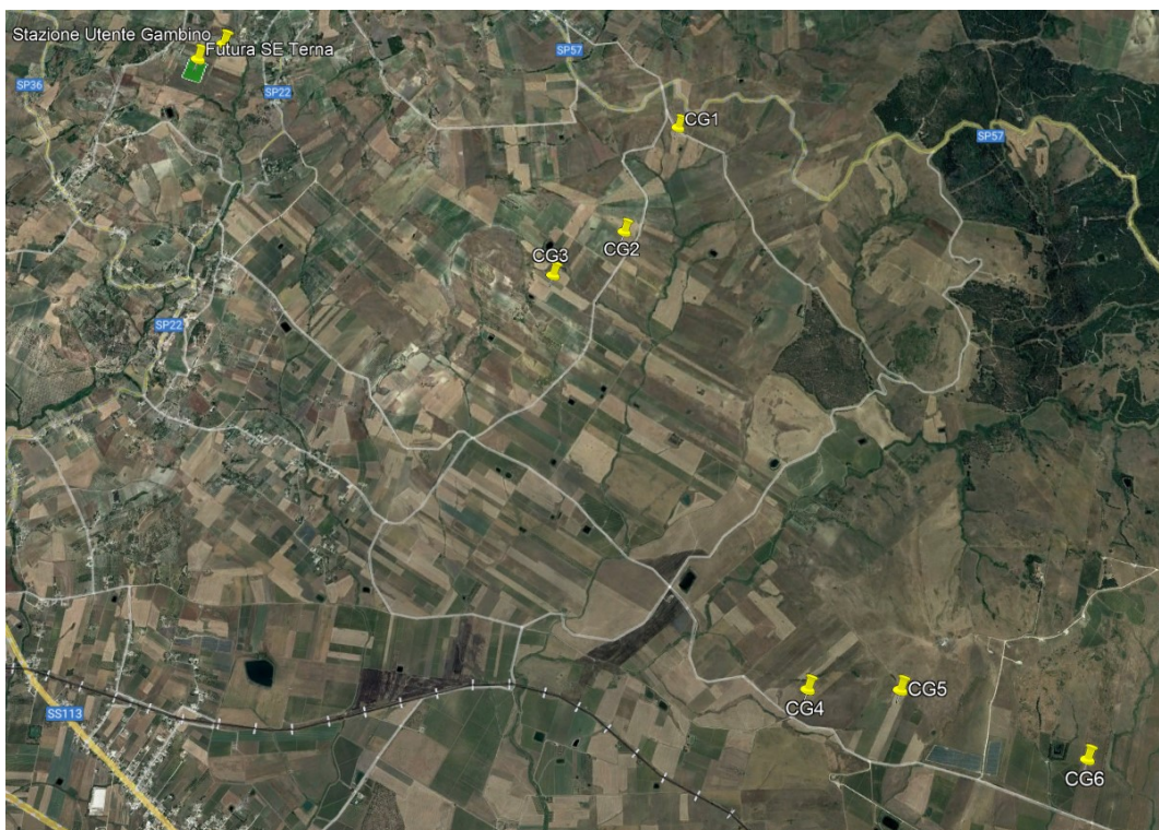
Figura 2 – Inquadramento territoriale del progetto (2/2)