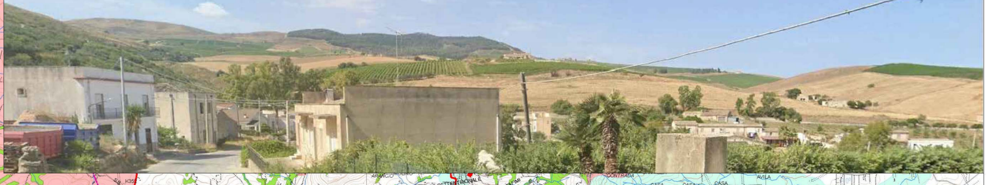
F5 - NUCLEO STORICO BALLATA DI BAIDA - Stato di fatto = Fotosimulazione