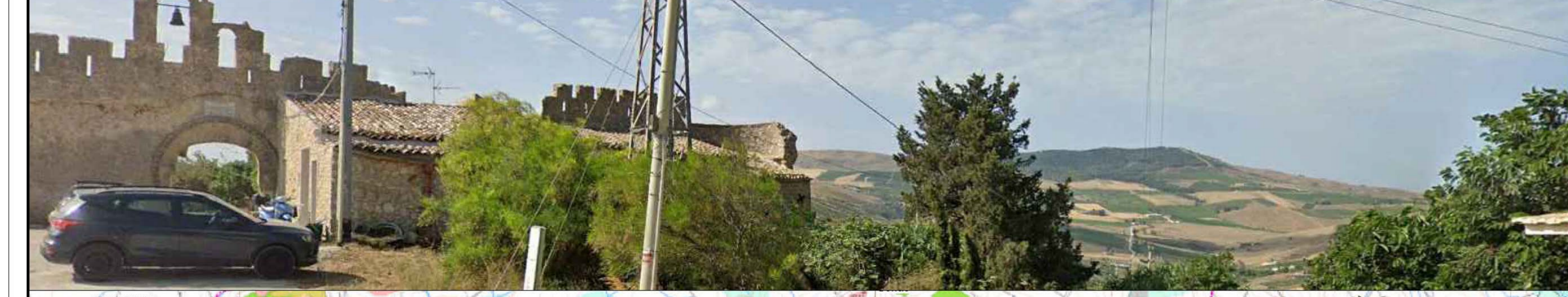
F4 - CASTELLO DI BAIDA - Stato di Fatto = Fotosimulazione