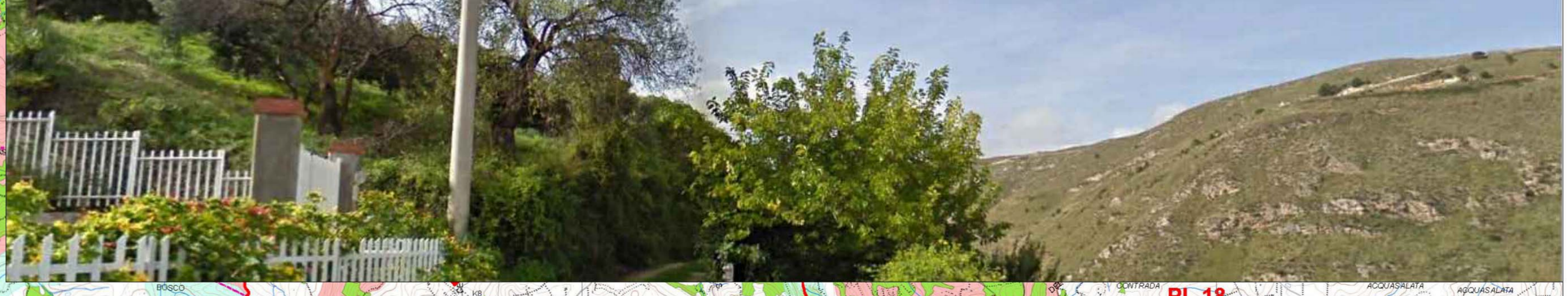
F6 - BAGLIO MULI - Stato di Fatto = Fotosimulazione