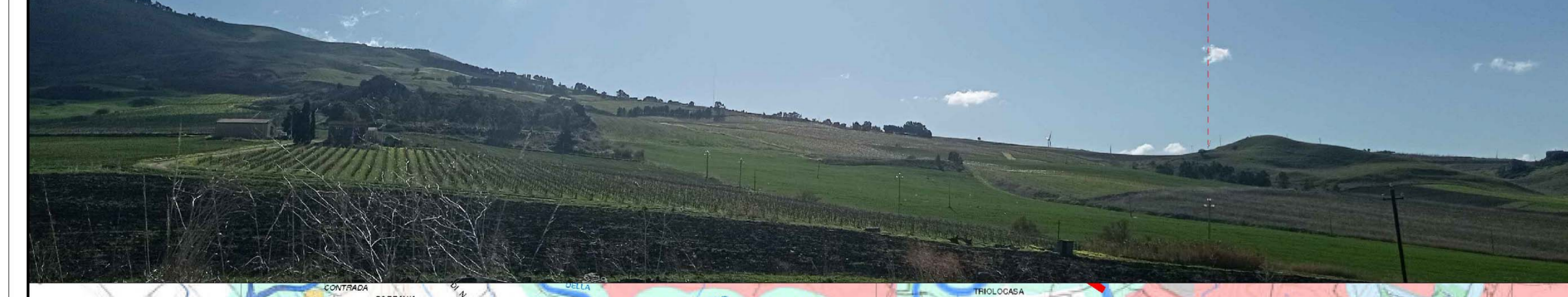
F3 - BAGLIO RACABBE - Fotosimulazione