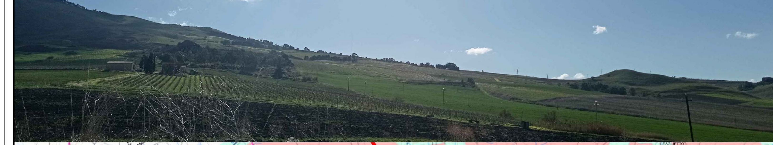
F3 - BAGLIO RACABBE - Stato di Fatto