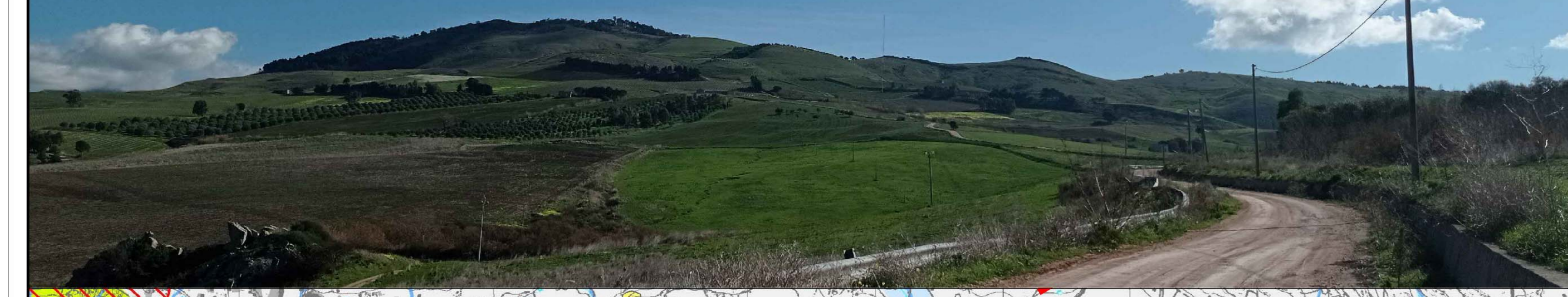
F1 - BAGLIO BEATRICE - Stato di Fatto = Fotosimulazione