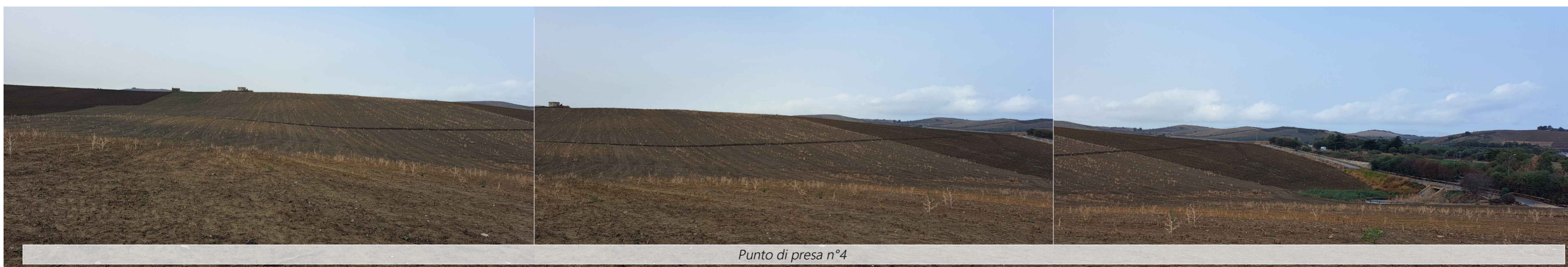
Punto di presa n°4