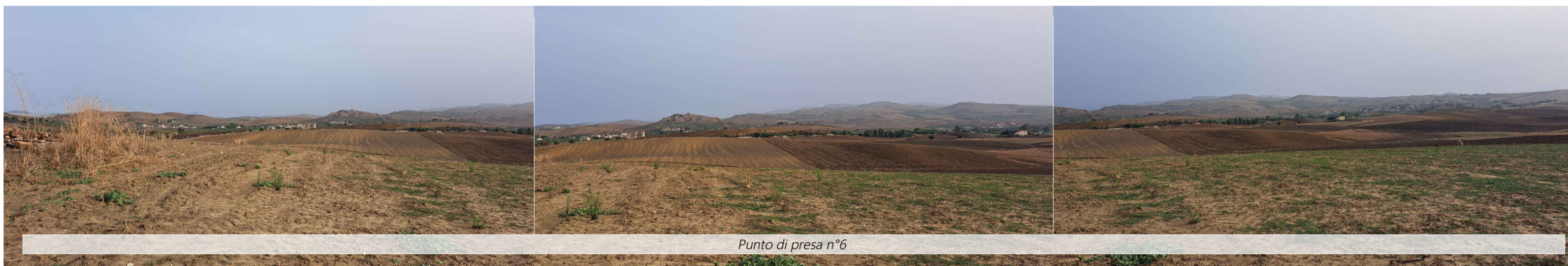
Punto di presa n°6