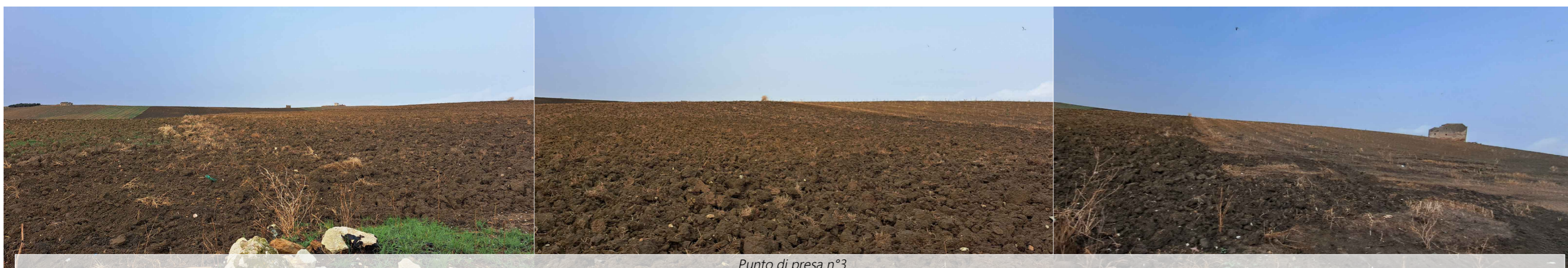
Punto di presa n°3