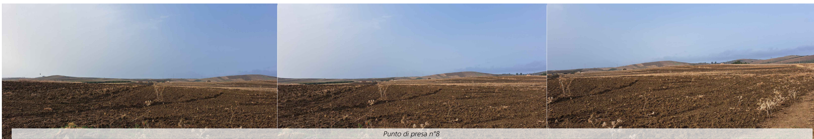
Punto di presa n°8