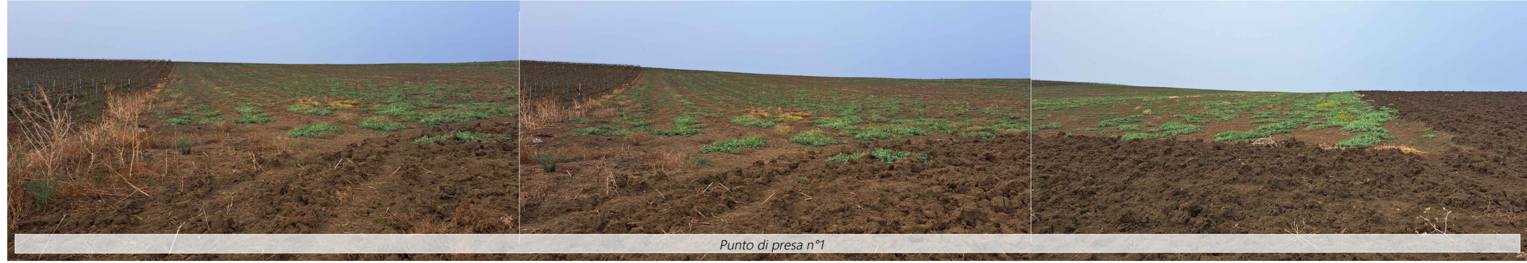
Punto di presa n°1