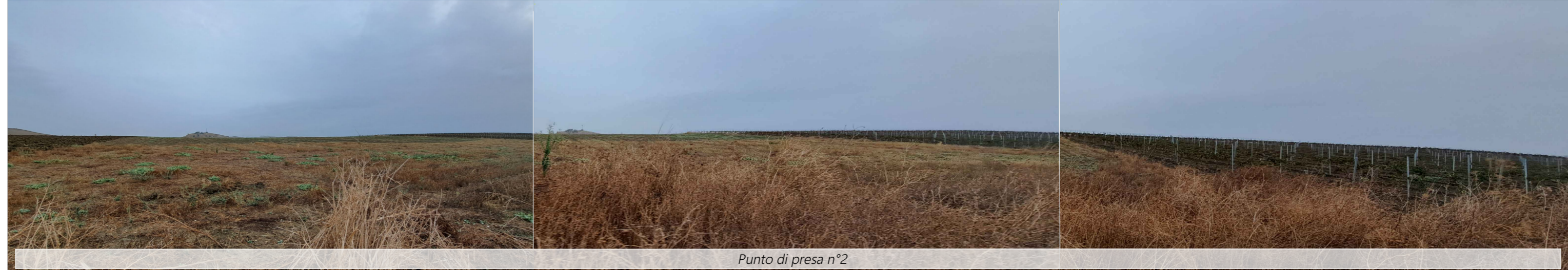
Punto di presa n°2