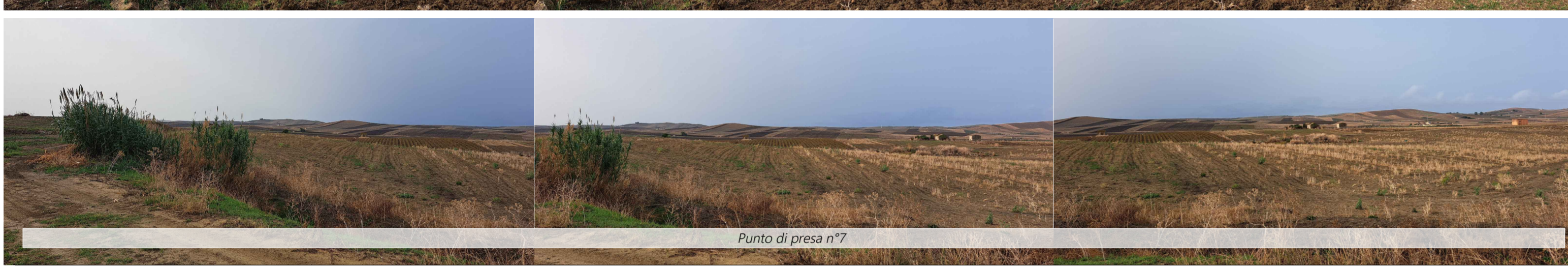
Punto di presa n°7