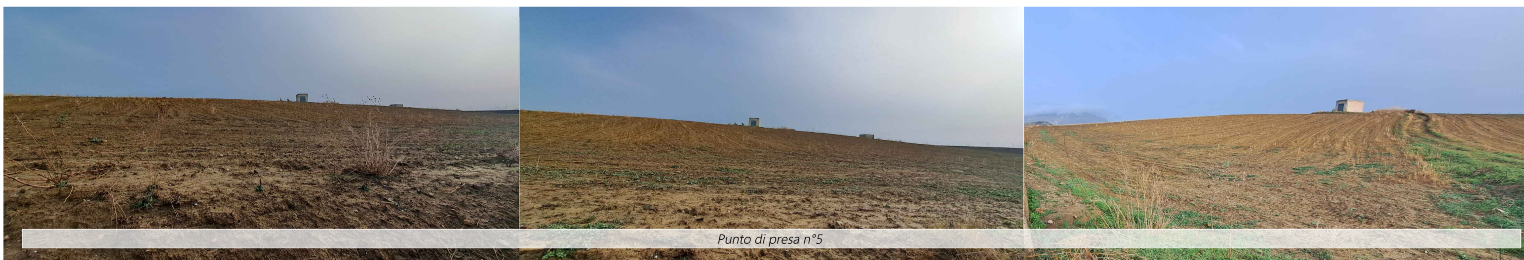
Punto di presa n°5