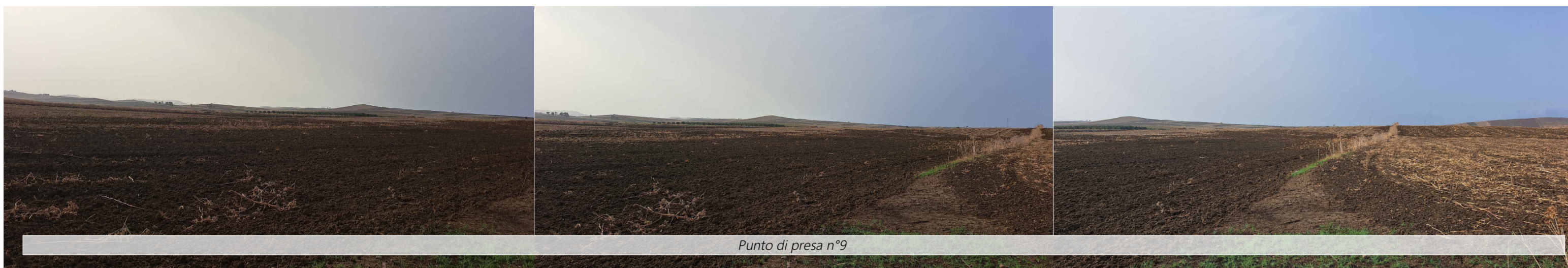
Punto di presa n°9