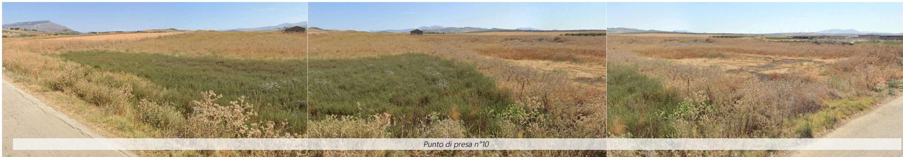
Punto di presa n°10