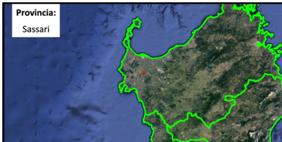
Figura 1 – Inquadramento dell'impianto FV su immagine satellitare

In Figura 1 è riportata la posizione del sito interessato su immagine satellitare, inquadrato nel territorio della Regione Sardegna.