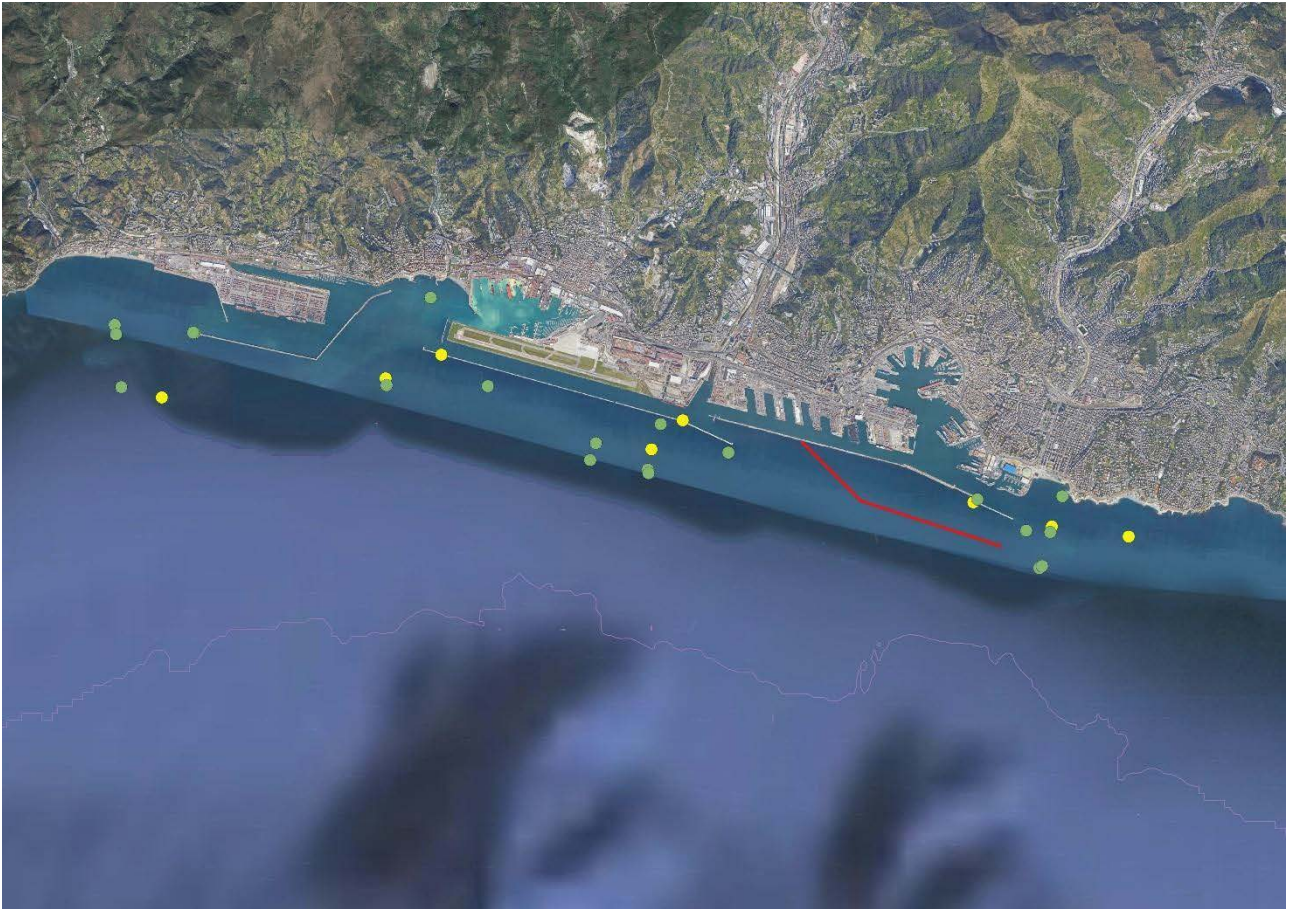
Figura 5 - Posizione delle stazioni di monitoraggio della rete regionale (in verde) e quelli relativi al progetto della nuova diga (in giallo)