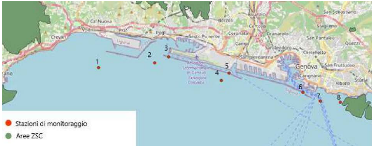
Figura 1 - Stazioni di monitoraggio Descrittore 8 per il campionamento degli inquinanti su colonna d'acqua e sedimento