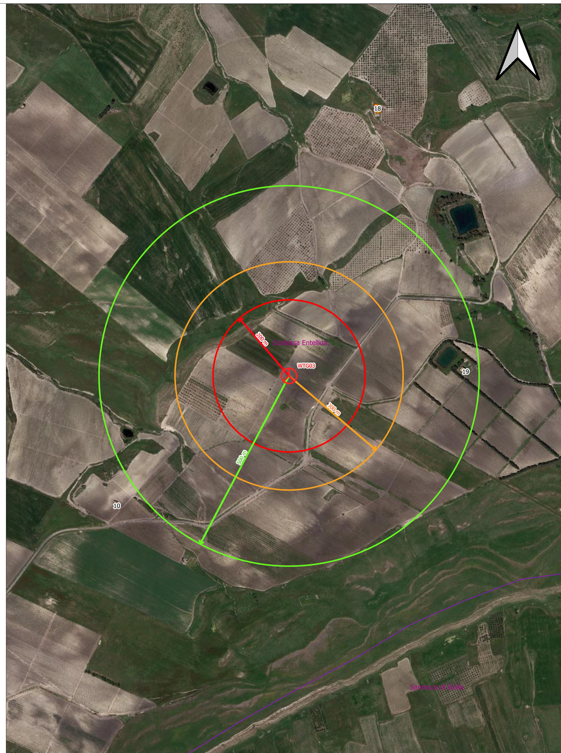
ESTRATTO DI ORTOFOTO CON INDICAZIONE DEI FABBRICATI SCALA 1:5.000

Fabbricati ricadenti a distanza inferiore a 500 m dall'aerogeneratore