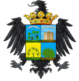
COMUNE DI MENFI