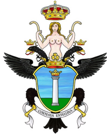
COMUNE DI CONTESSA ENTELLINA