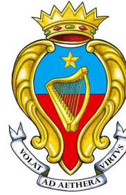
COMUNE DI SAMBUCA DI SICILIA