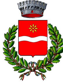
COMUNE DI SANTA MARGHERITA DI BELICE