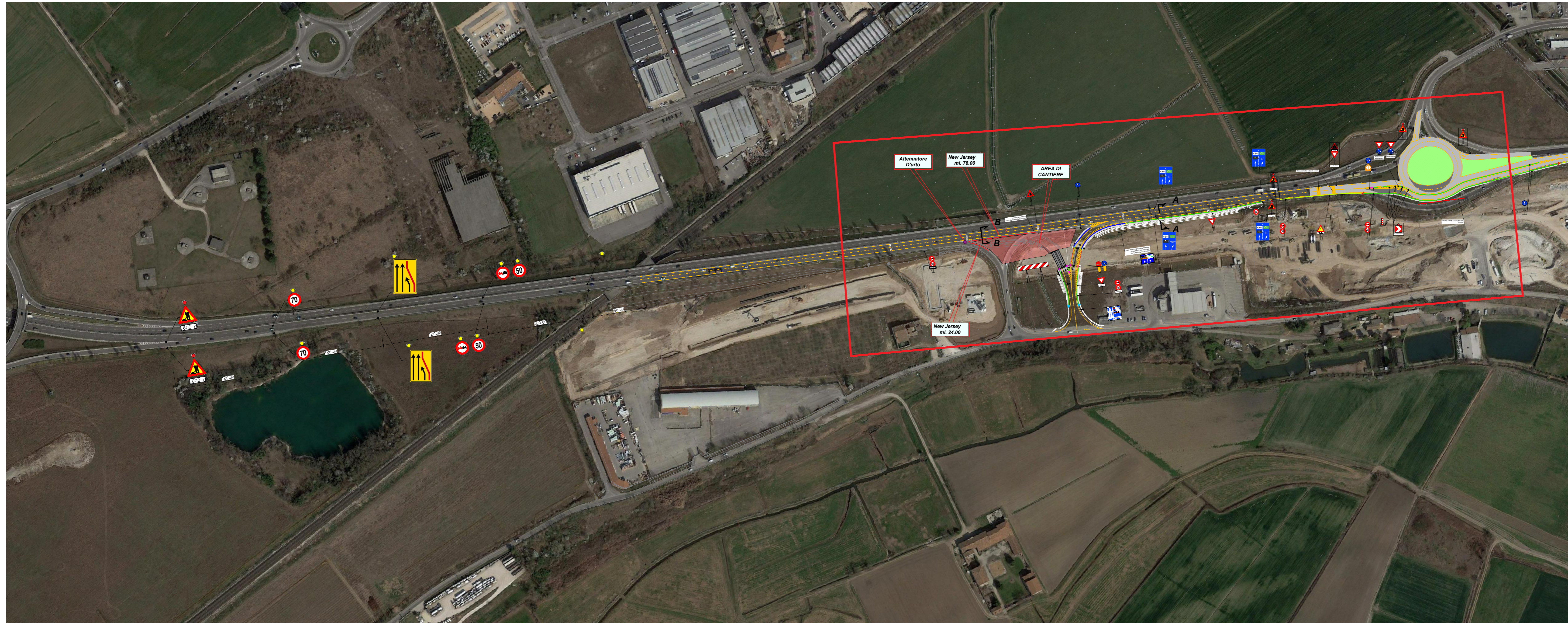
SEZIONE A - A