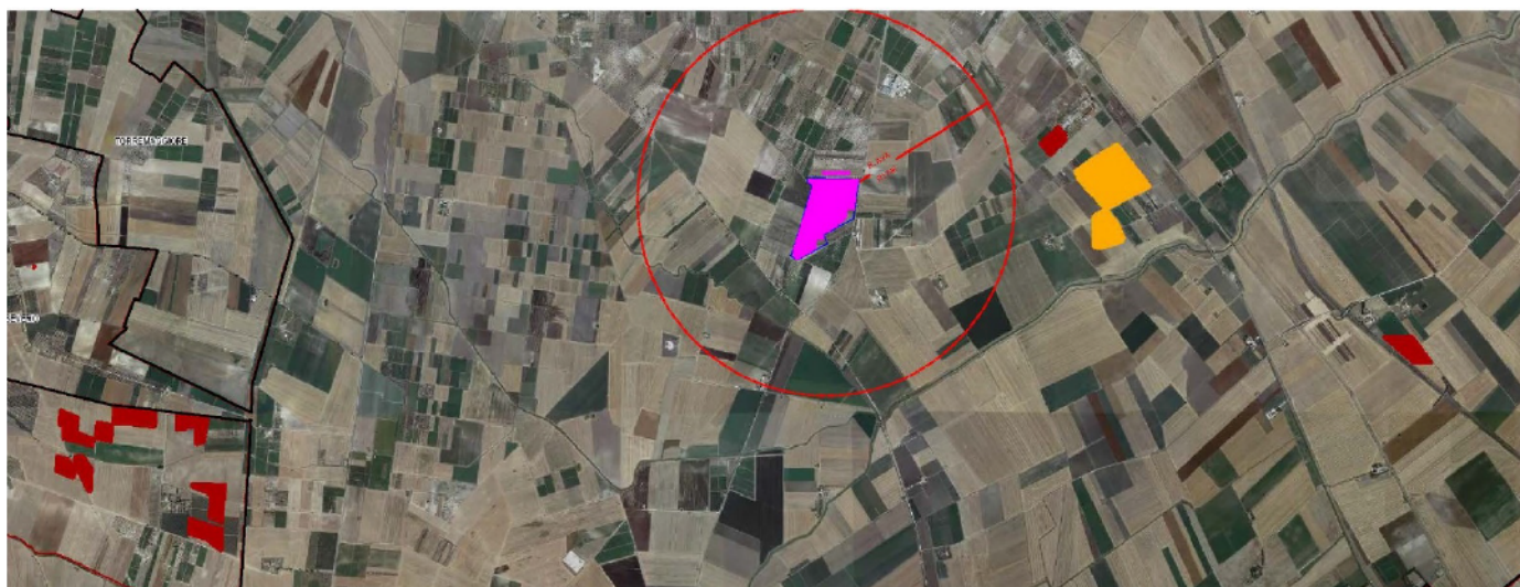
Figura 3 - Applicazione grafica dell'IPC al progetto.

Ciò determina che il valore di SIT, ovvero la superficie in m 2 di impianti fotovoltaici autorizzati, realizzati e in corso di autorizzazione unica, sia pari a zero; pertanto il valore di IPC del criterio è altrettanto pari a zero .