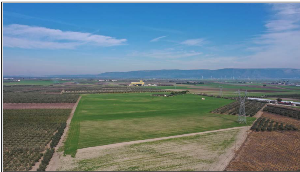
Figura 3 - Terreno vista da sud

A seguire alcune foto del sito oggetto di intervento, alcune delle quali effettuate dall'alto con l'ausilio di un drone.