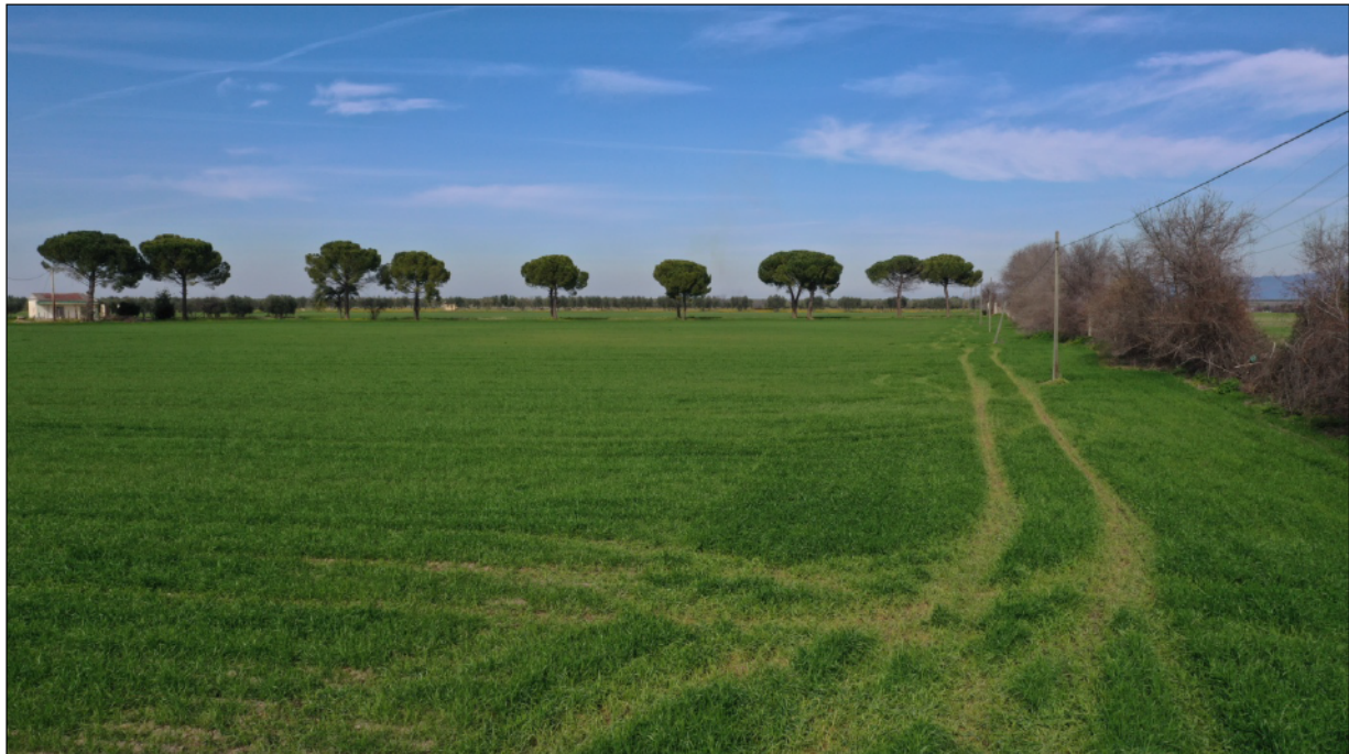
Figura 5 - Terreno di proprietà Clemente Luigi.