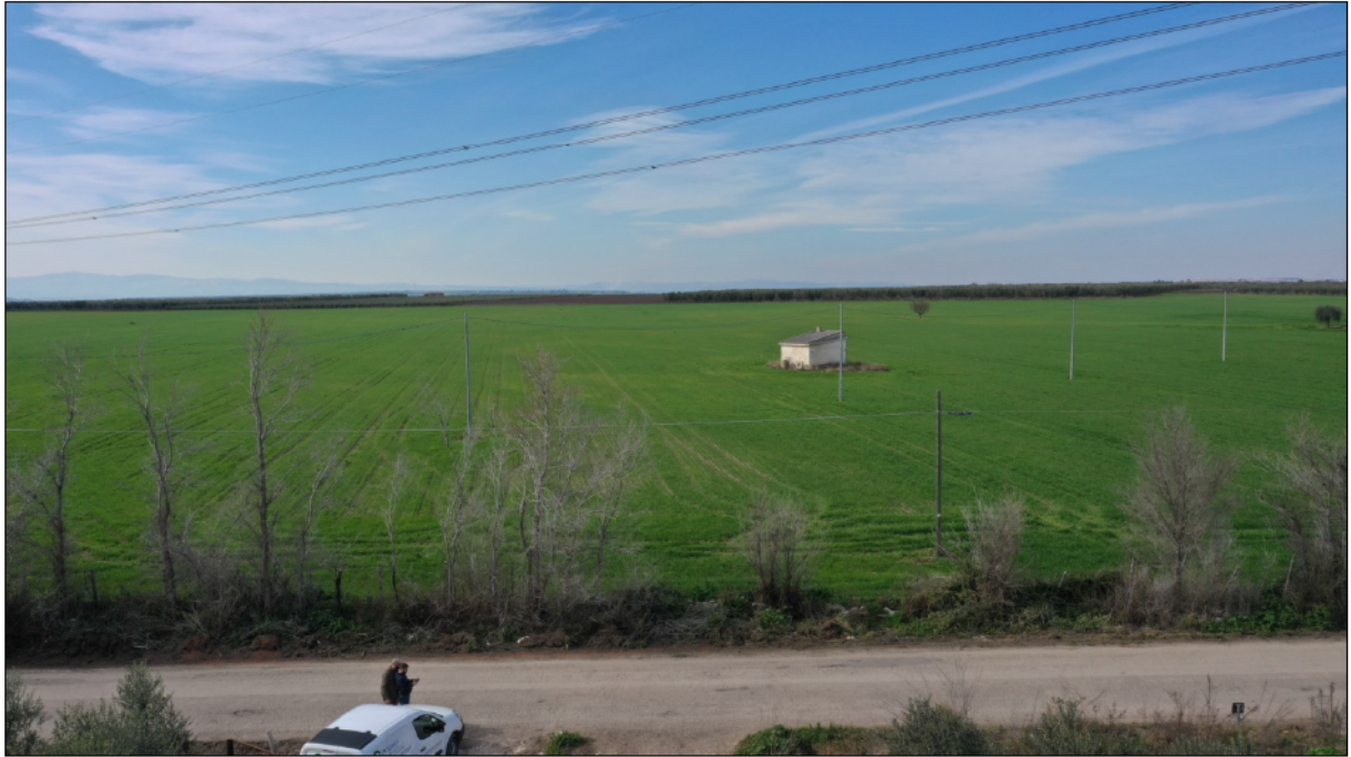
Figura 4 - Terreno vista da Est dalla SP 20