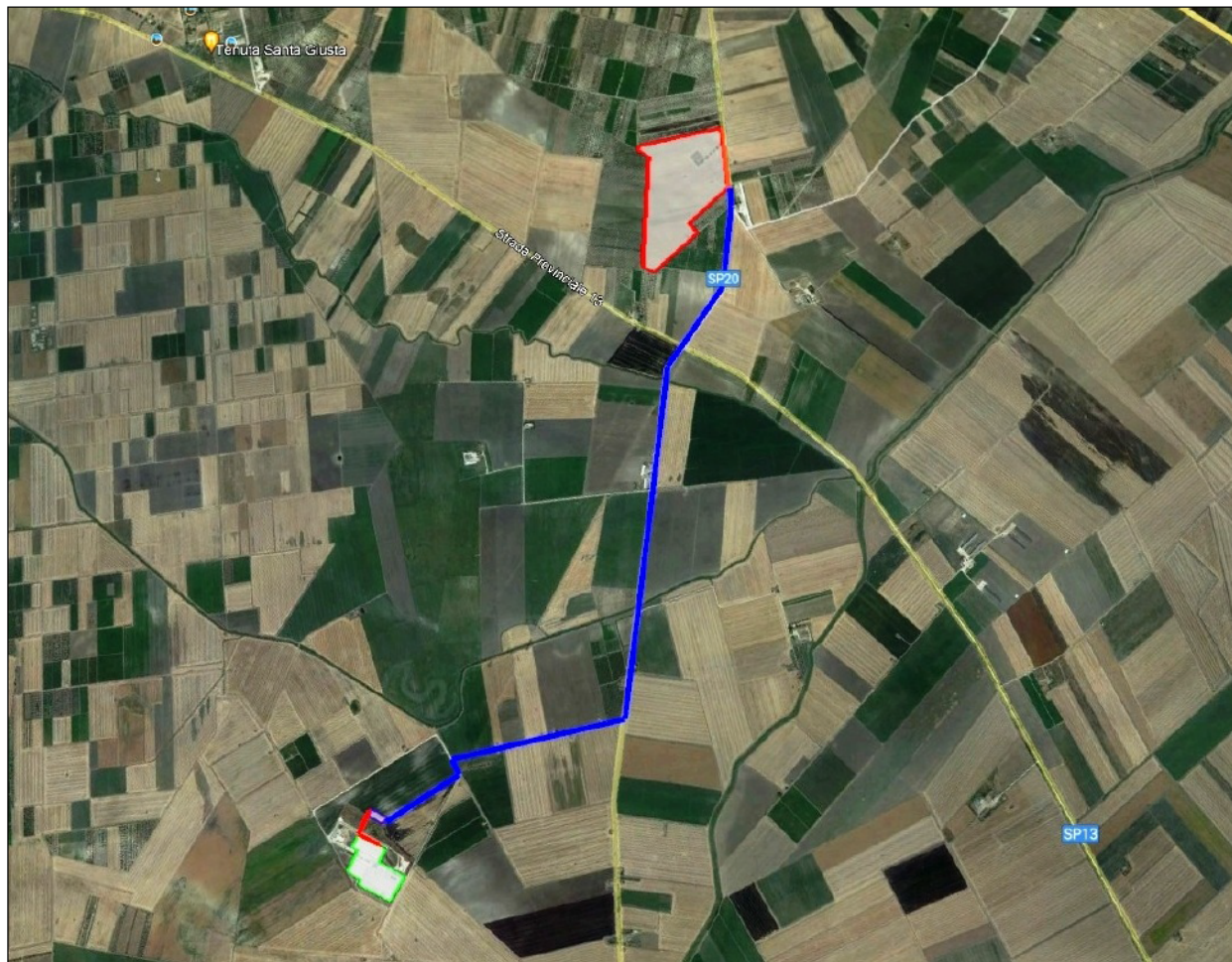
Figura 2 - Inquadramento su Ortofoto del progetto.

A seguire alcune foto del sito oggetto di intervento, alcune delle quali effettuate dall'alto con l'ausilio di un drone.