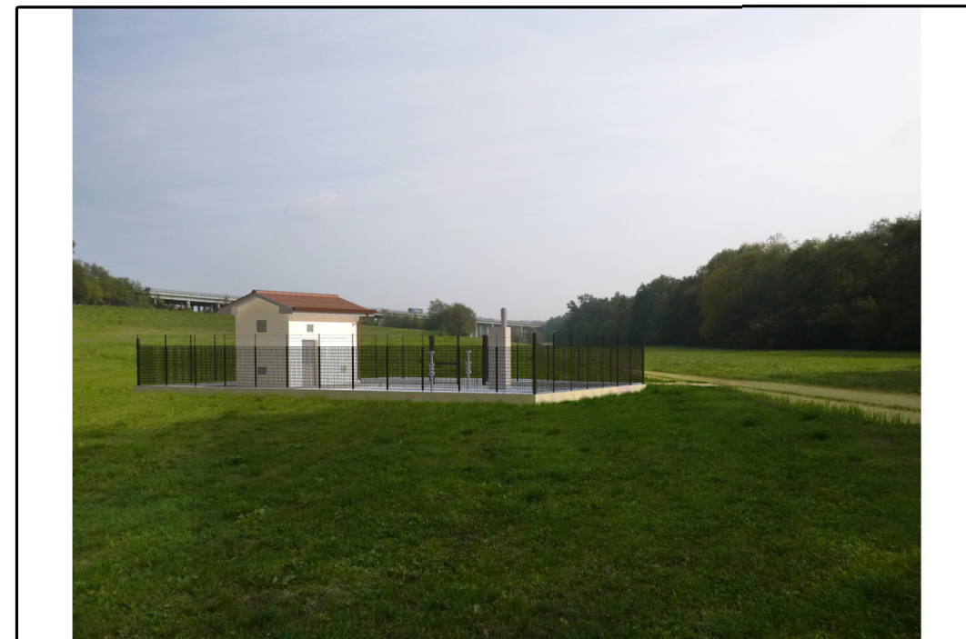
VISTA 2: STATO DI PROGETTO