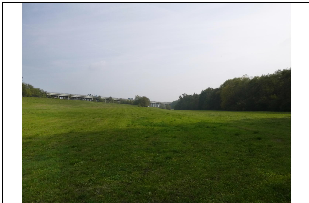
VISTA 1: STATO DI FATTO