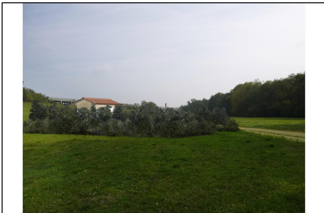
VISTA 3: STATO DI PROGETTO CON MASCHERAMENTO