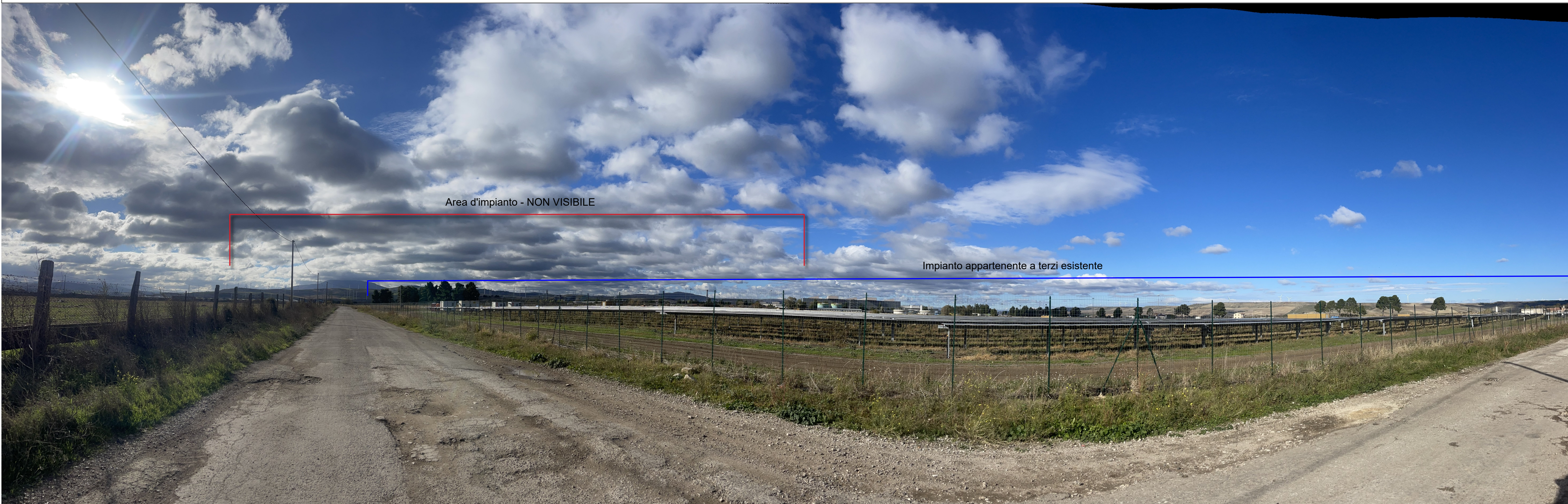
Panoramica - individuazione ingombro impianto