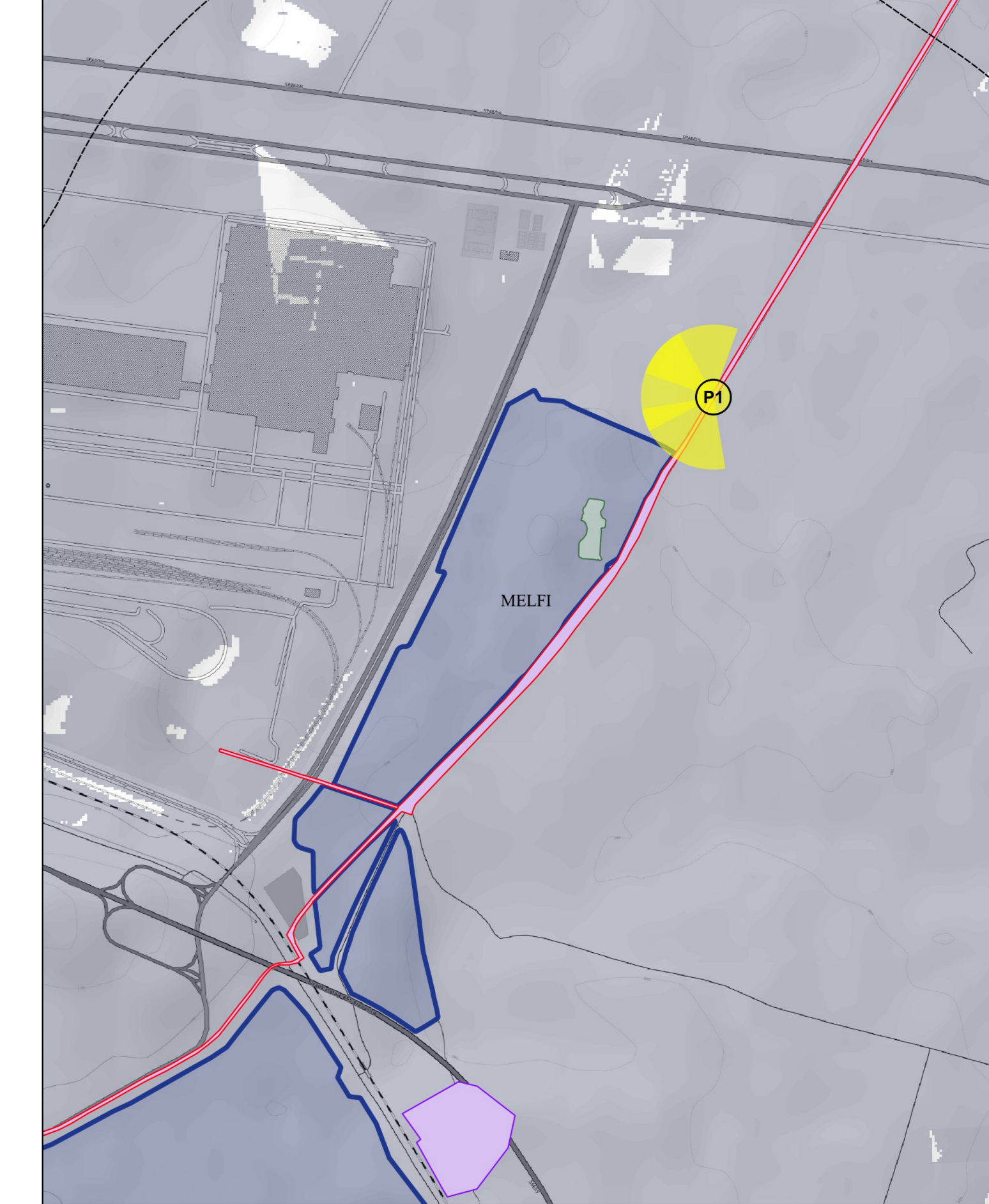
Individuazione con ottici su ortofoto - Scala 1:5.000