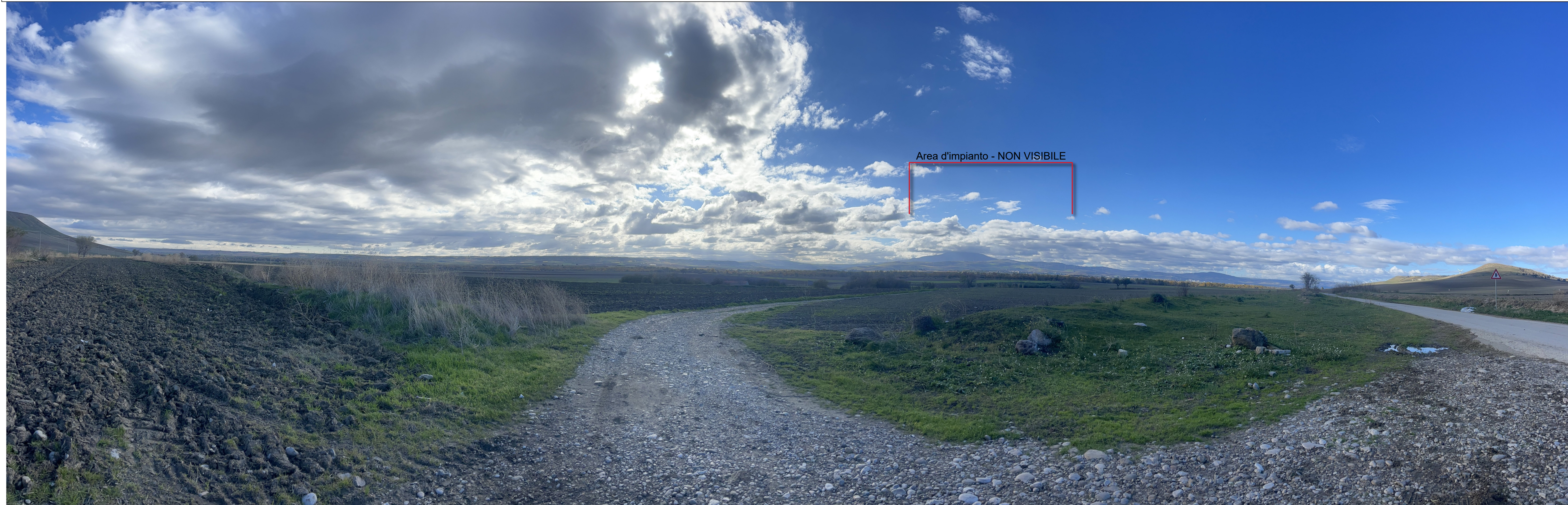
Panoramica - individuazione ingombro impianto