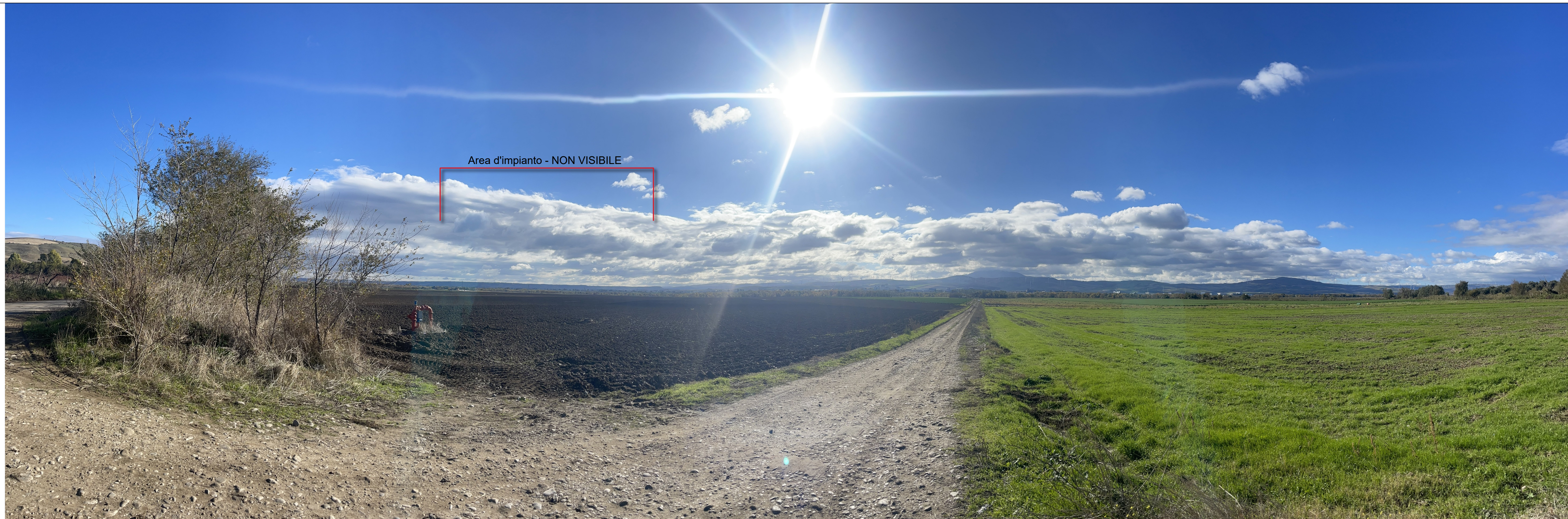
Panoramica - individuazione ingombro impianto