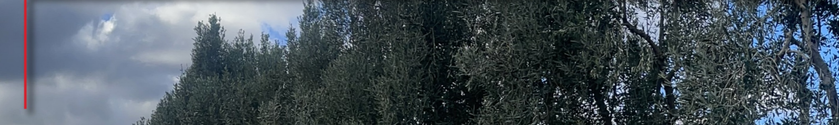
Documentazione fotografica: Stato di fatto