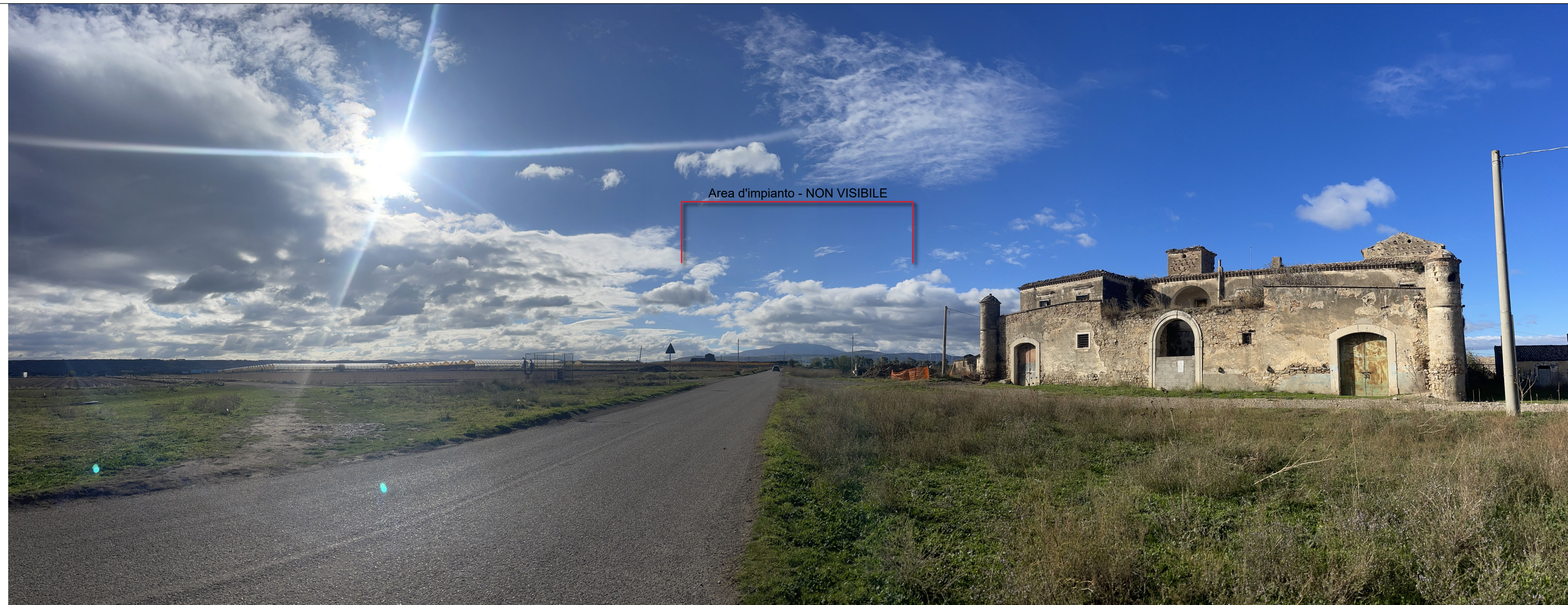
Panoramica - individuazione ingombro impianto