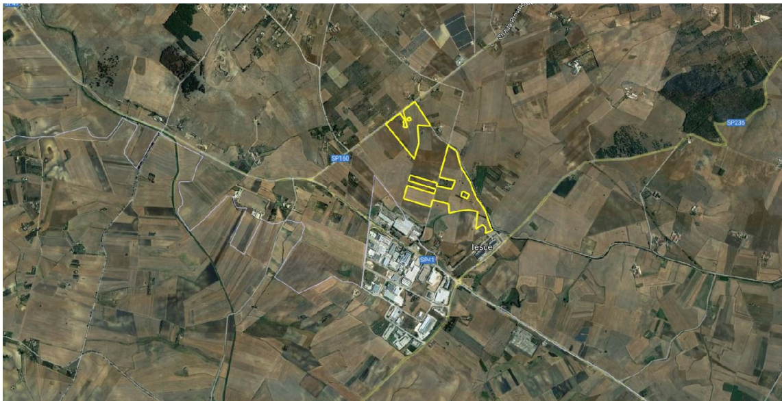
Fig. 1 - Localizzazione dell'impianto