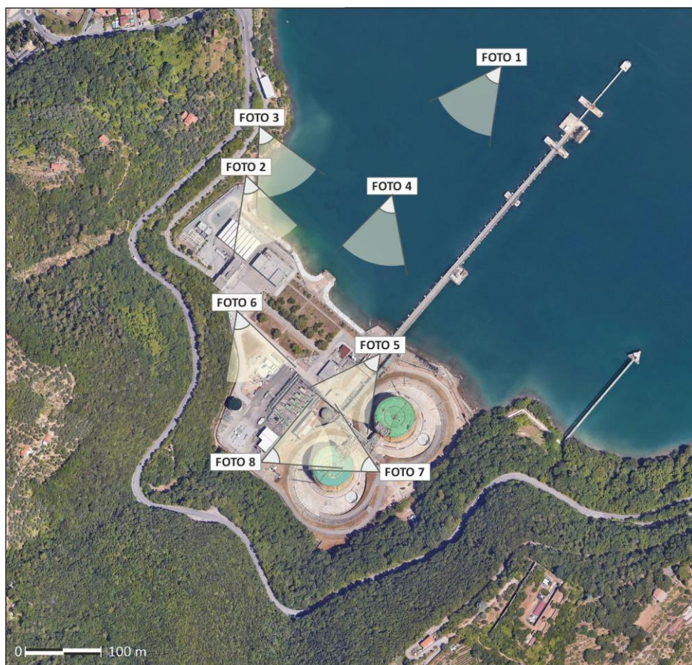
Figura 1: Ubicazione degli scatti fotografici con cono visivo

Le foto sono riportate nel successivo paragrafo 1.2.