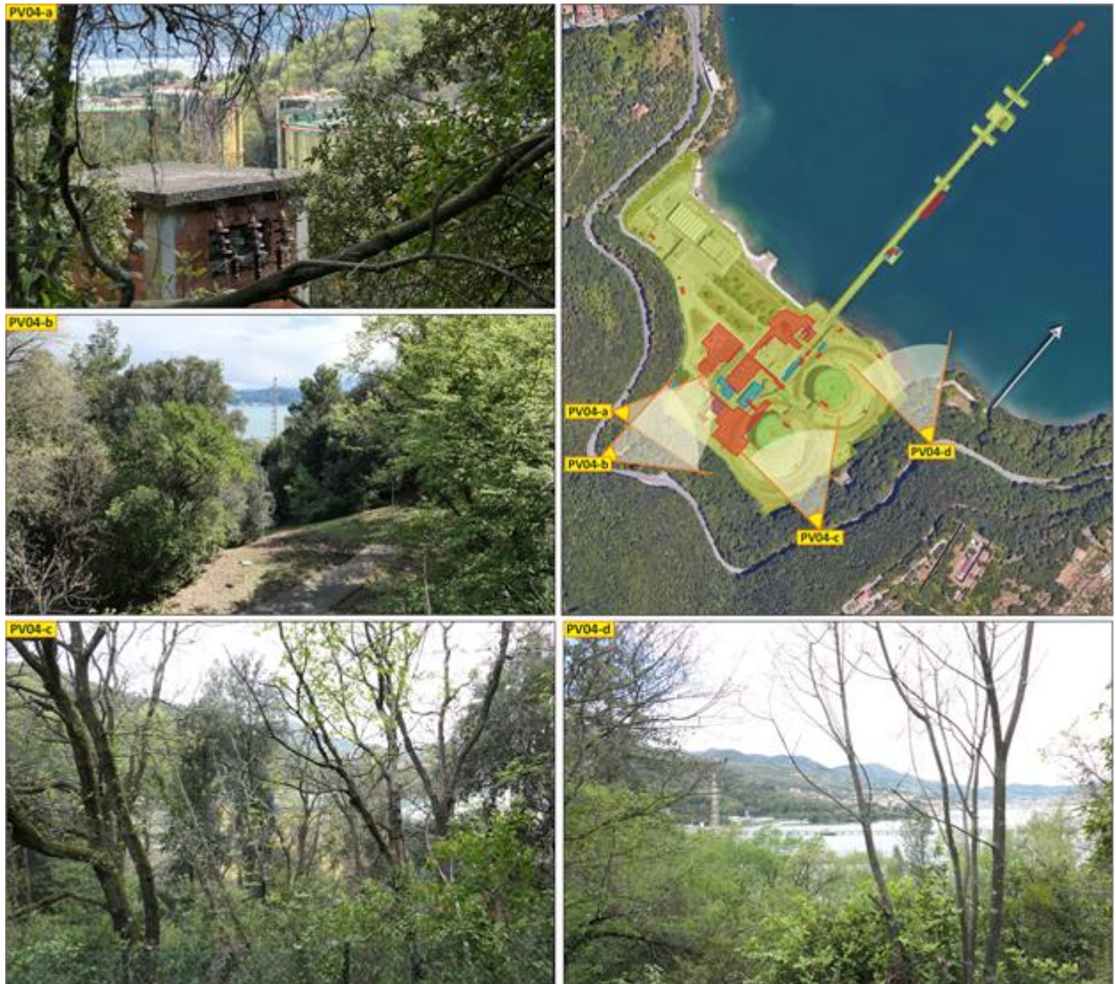
Figura 14- Vista 4 ante e post operam (Terminale non visibile)