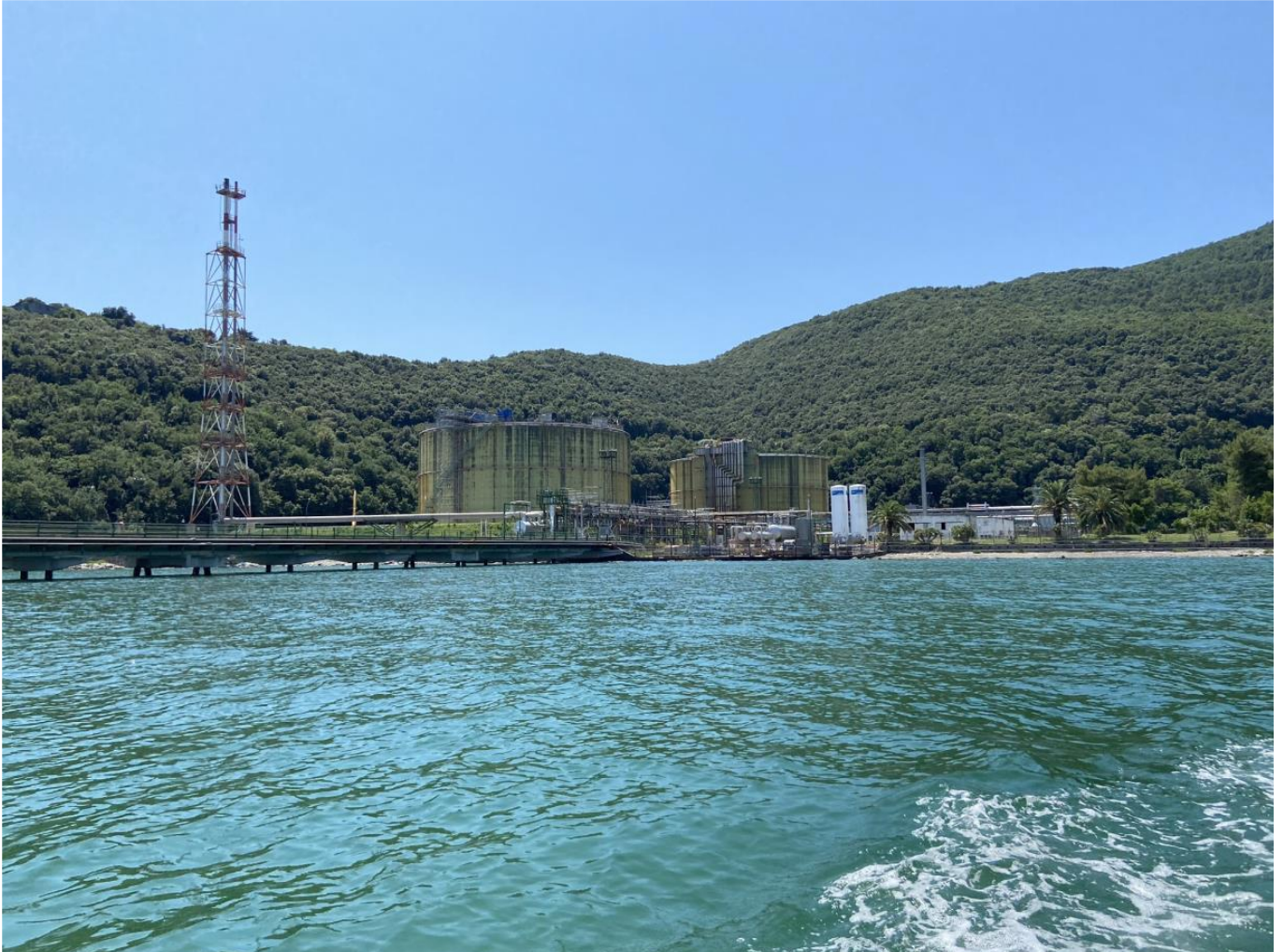
Figura 5: Vista del Terminale da mare (foto 4)

Rif. Cod. Soc. Prog.: 0698-TITA-H-DA-000-102