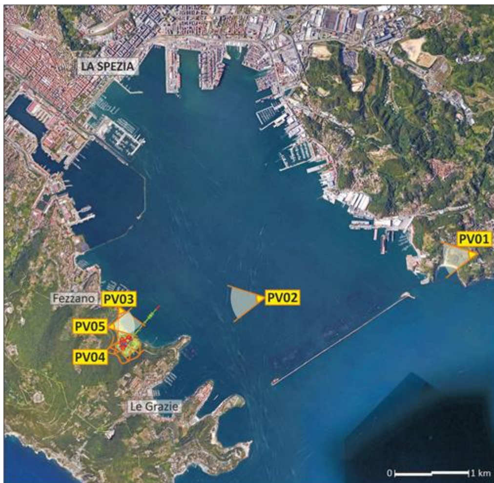
Figura 10: Punti di vista considerati per le fotosimulazioni