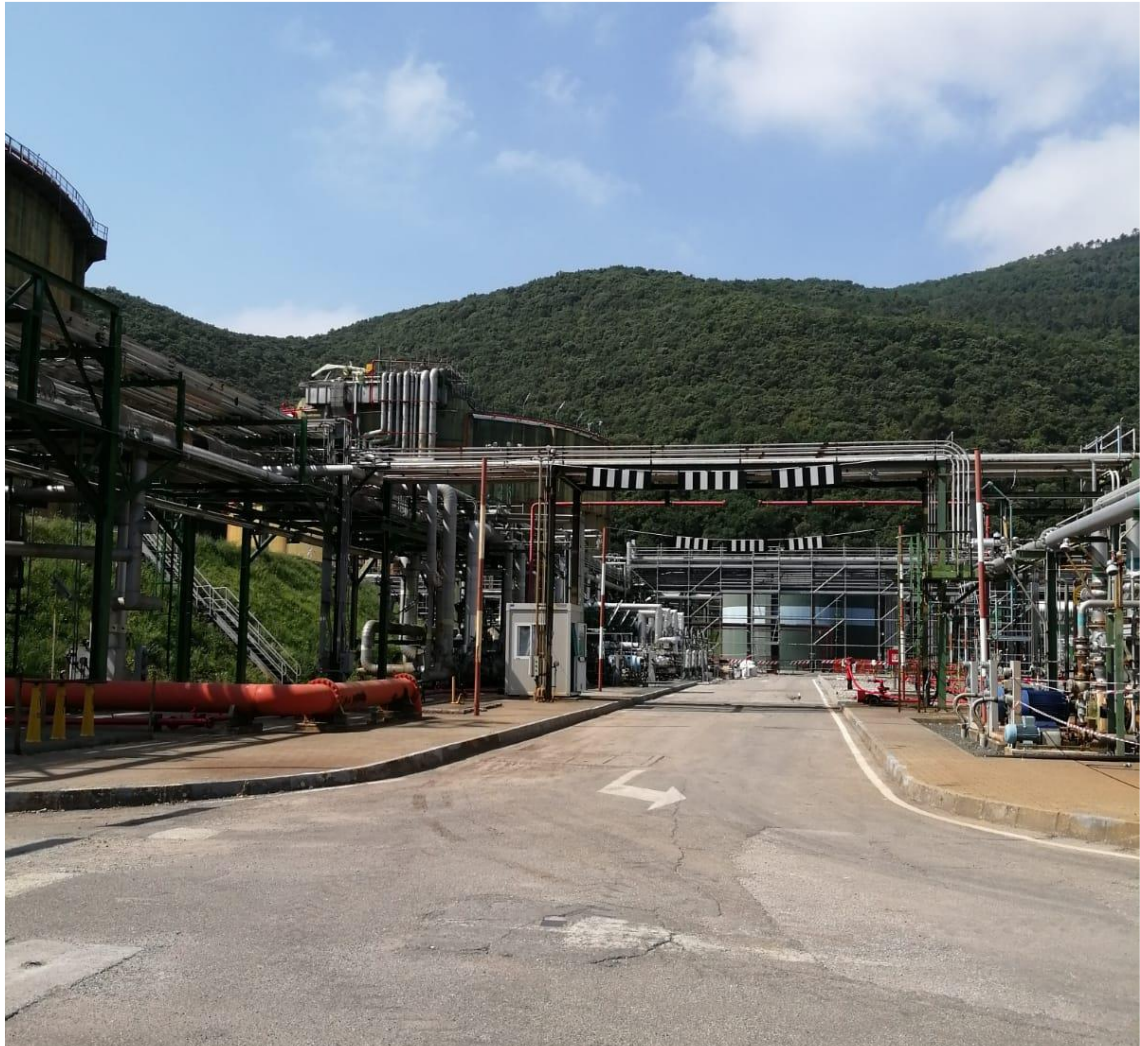
Figura 6: Vista Pipe rack da terra (foto 5)

Rif. Cod. Soc. Prog.: 0698-TITA-H-DA-000-102