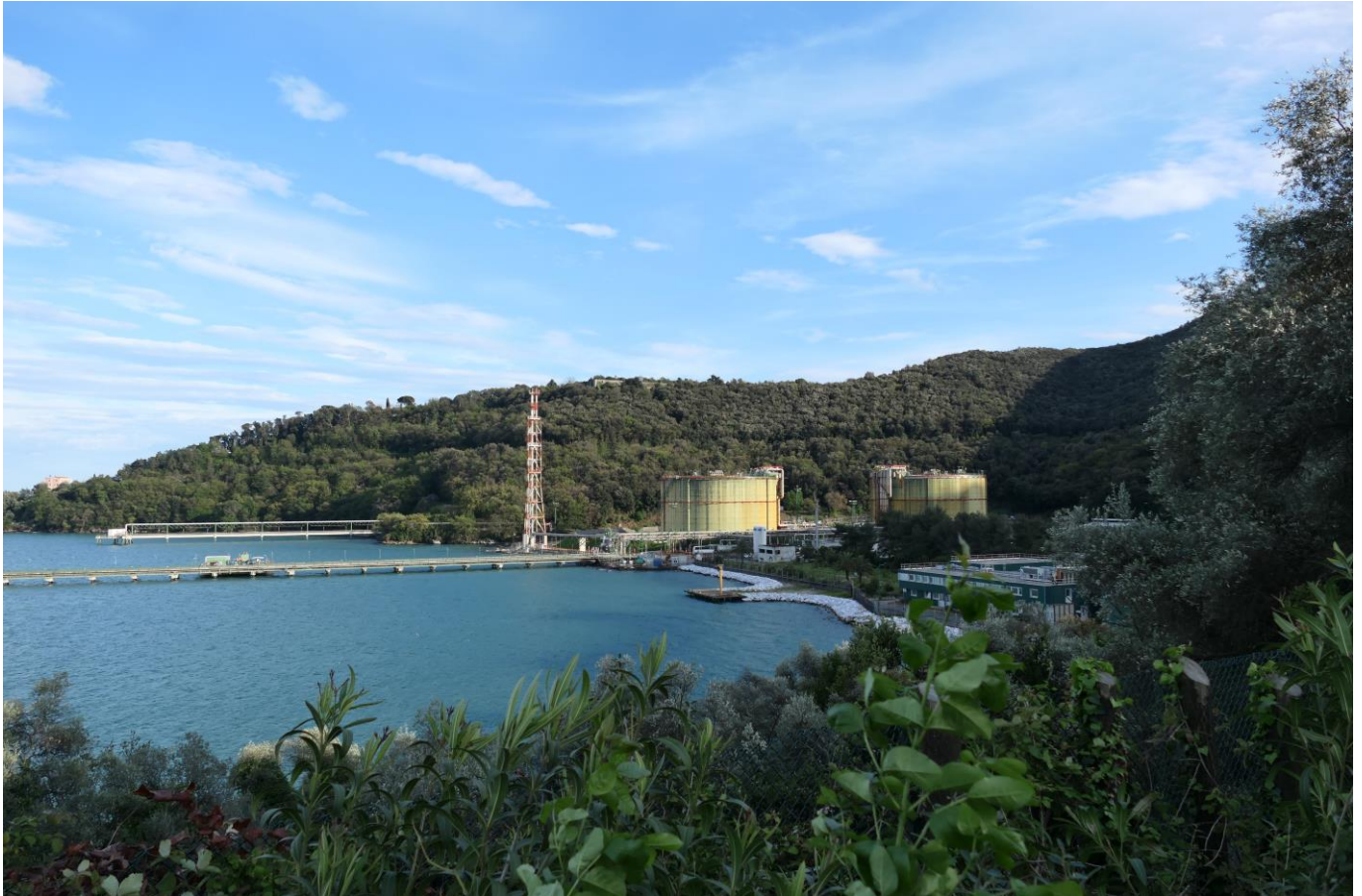
Figura 4: Vista del Terminale da Nord dall'alto (foto 3)

Rif. Cod. Soc. Prog.: 0698-TITA-H-DA-000-102