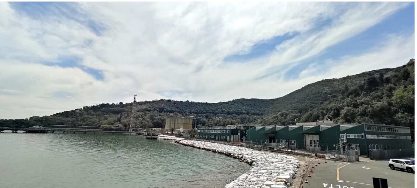
Figura 3: Vista del Terminale da Nord da terra (foto 2)