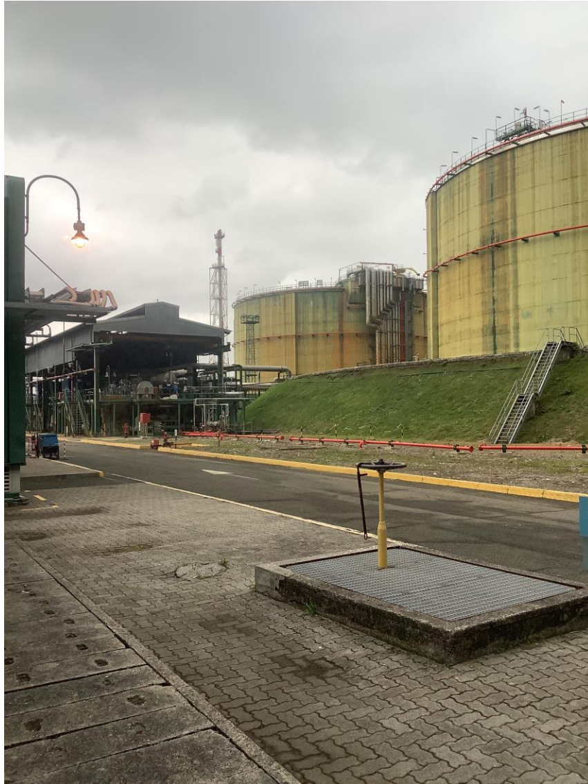
Figura 9: Vista tanks da terra (foto 8)

Rif. Cod. Soc. Prog.: 0698-TITA-H-DA-000-102