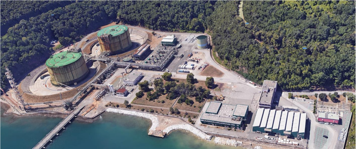
Figura 2: Vista del Terminale dall'alto (foto 1)