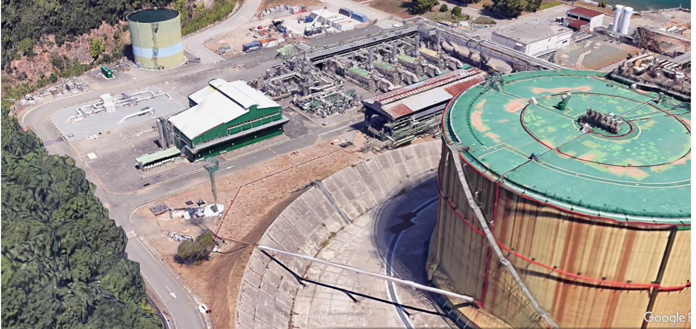
Figura 8: Vista Area recondenser dall'alto (foto 7)

Rif. Cod. Soc. Prog.: 0698-TITA-H-DA-000-102