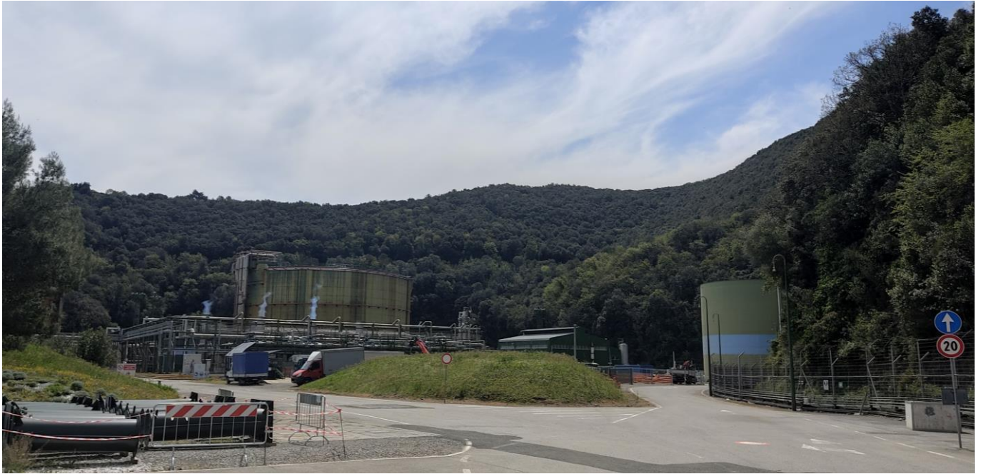
Figura 7: Vista da Area deposito materiali da terra (foto 6)

Rif. Cod. Soc. Prog.: 0698-TITA-H-DA-000-102