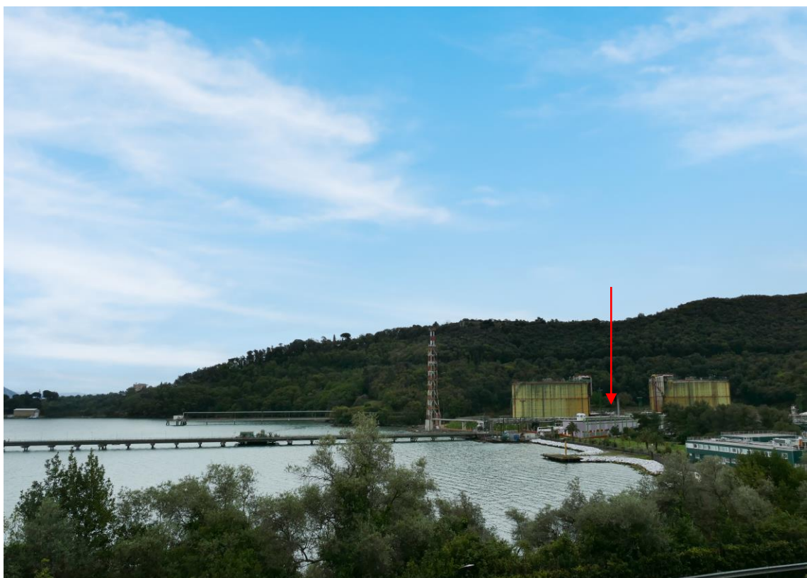
Figura 13- Vista 3 ante operam (sopra) e post operam (sotto)