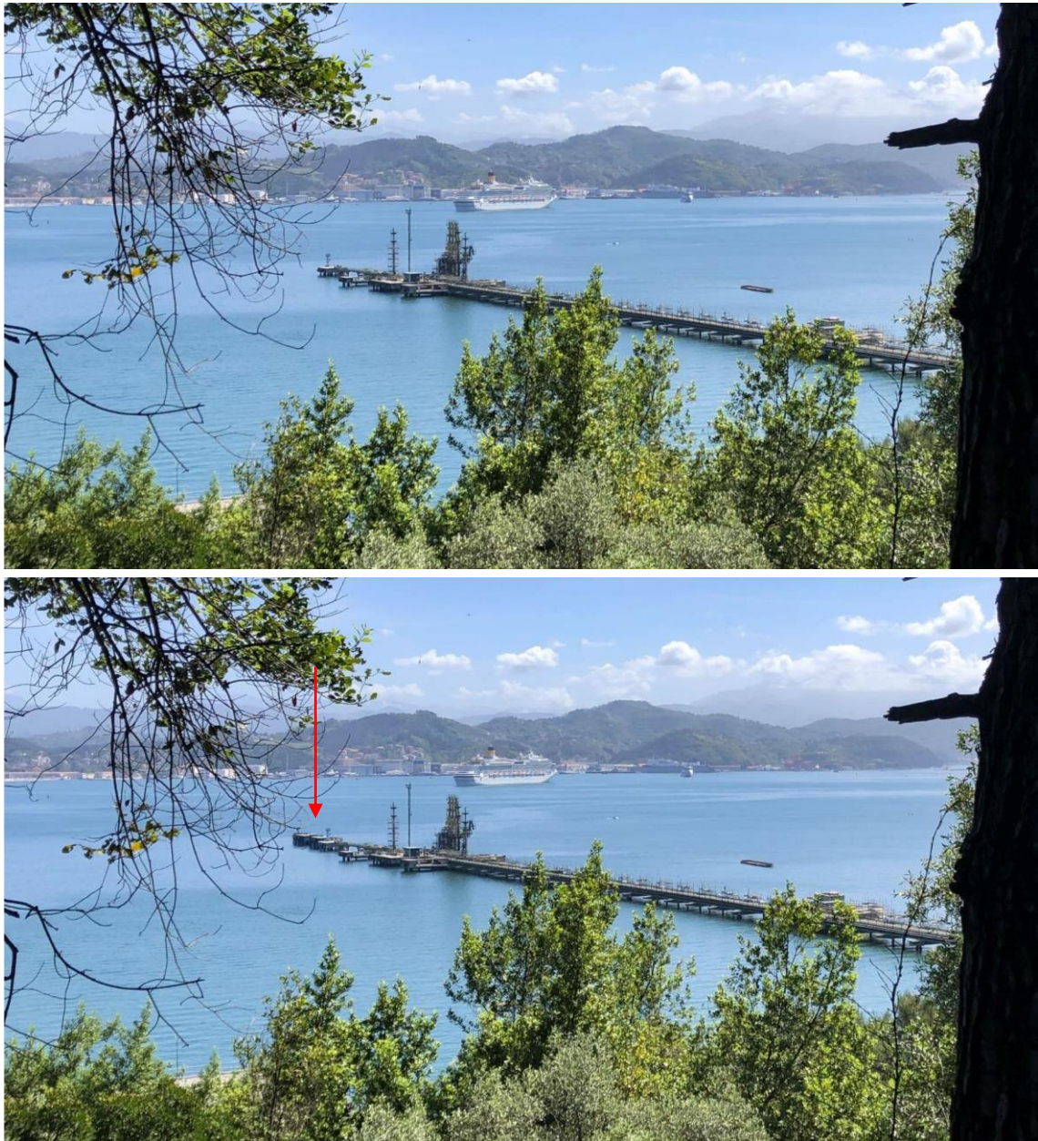
Figura 15- Vista 5 ante operam (sopra) e post operam (sotto)