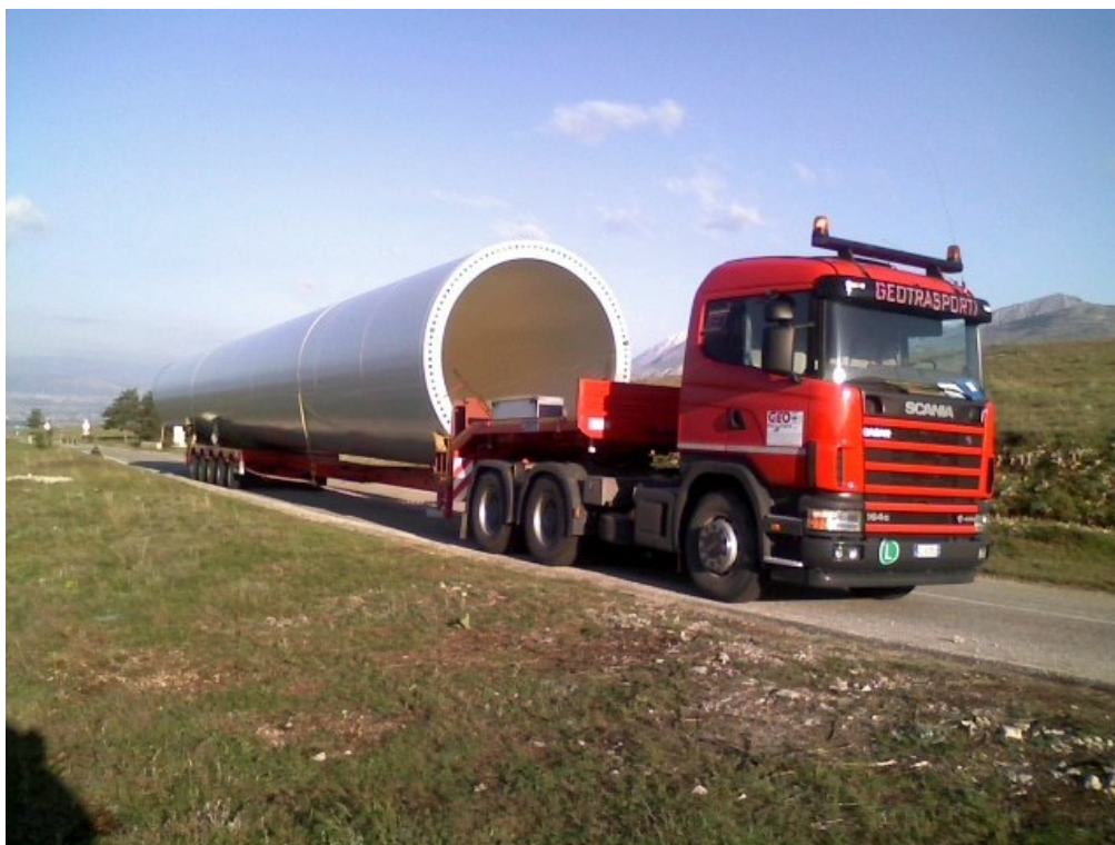
Figura 2 | Trasporto componenti – torre eolica

Progetto dell'impianto eolico e relative opere di connessione denominato "Contrada Magliana" della potenza complessiva di 59,40 MW da realizzare nei Comuni di Veglie (LE), Salice Salentino (LE), Guagnano (LE), Campi Salentina (LE) e Cellino San Marco (BR).