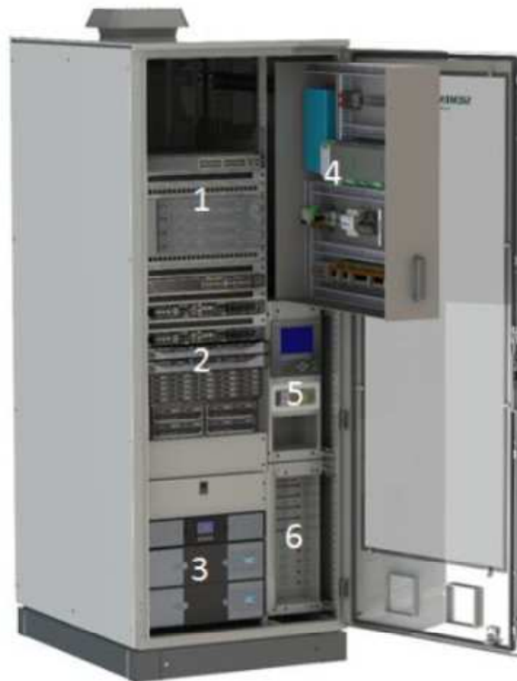
Figura 1 | Esempio di un Armadio SCADA

L'armadio SCADA sarà installato nella sala di controllo dell'edificio della sottostazione, il luogo di installazione deve garantire una temperatura ambiente compresa tra 15 °C e 25 °C.