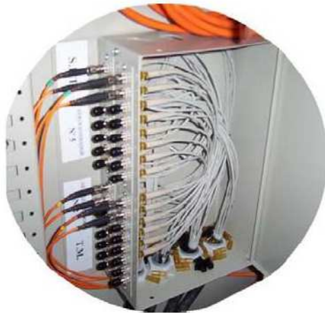
Figura 5 | Scatola di distribuzione per connessione fibre ottiche

Progetto dell'impianto eolico e relative opere di connessione denominato "Contrada Magliana" della potenza complessiva di 59,40 MW da realizzare nei Comuni di Veglie (LE), Salice Salentino (LE), Guagnano (LE), Campi Salentina (LE) e Cellino San Marco (BR).