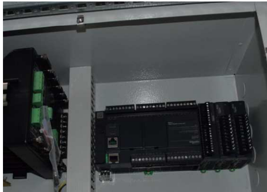
Figura 4 | Dettaglio di installazione del PLC

Progetto dell'impianto eolico e relative opere di connessione denominato "Contrada Magliana" della potenza complessiva di 59,40 MW da realizzare nei Comuni di Veglie (LE), Salice Salentino (LE), Guagnano (LE), Campi Salentina (LE) e Cellino San Marco (BR).