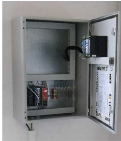
Figura 3 | Quadro Trasduttori

Progetto dell'impianto eolico e relative opere di connessione denominato "Contrada Magliana" della potenza complessiva di 59,40 MW da realizzare nei Comuni di Veglie (LE), Salice Salentino (LE), Guagnano (LE), Campi Salentina (LE) e Cellino San Marco (BR).