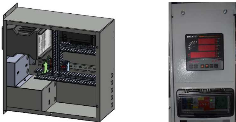
Figura 2 | Trasduttori di misura

L'armadio trasduttori viene impiegato per il trasferimento dei valori di misura del punto di connessione (P, Q, V, f, ...), dei trasformatori di corrente (TA) e dei trasformatore di tensione (TV).