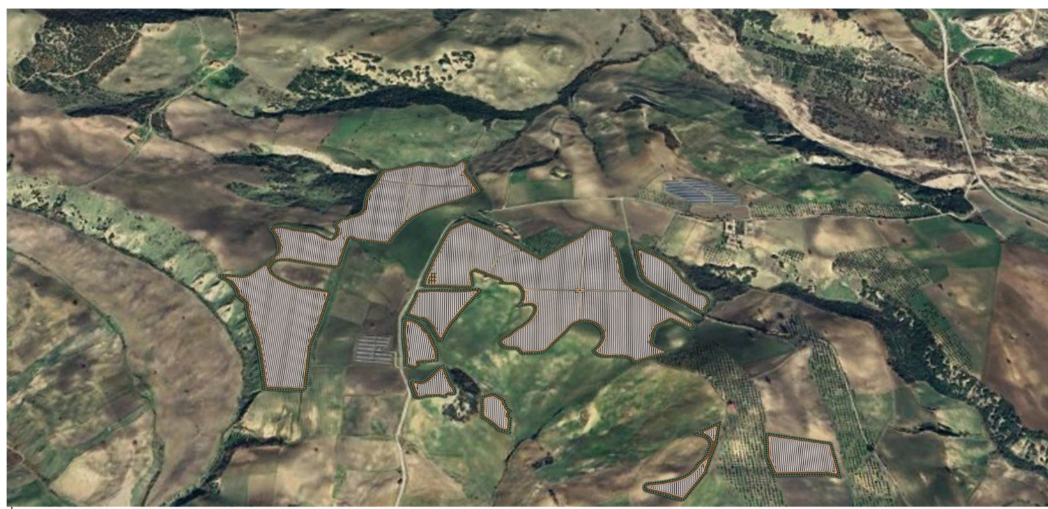
VISTA NORD - IMPIANTO PIANO DI LINO