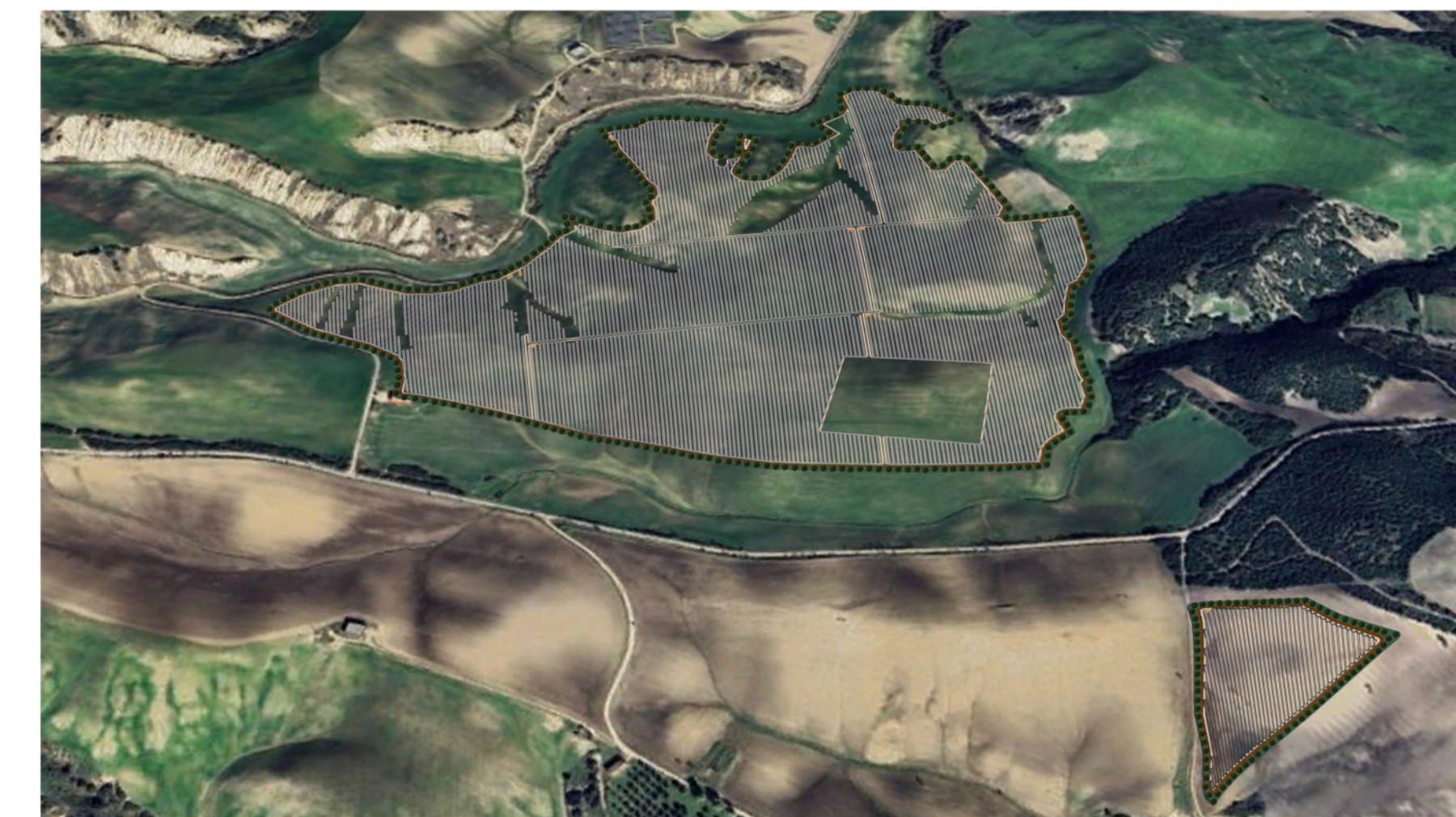
VISTA NORD - IMPIANTO PIANO MELE