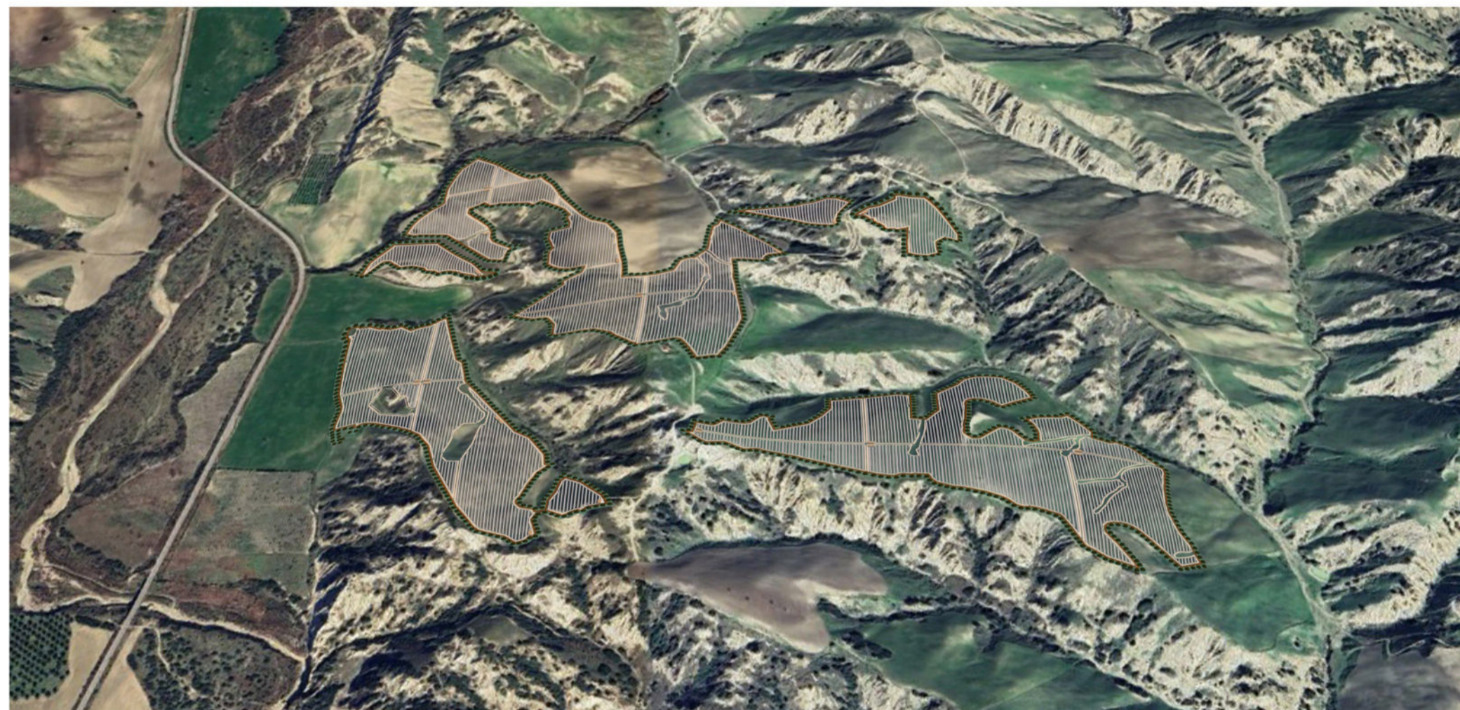
VISTA NORD - IMPIANTO LOMBONE