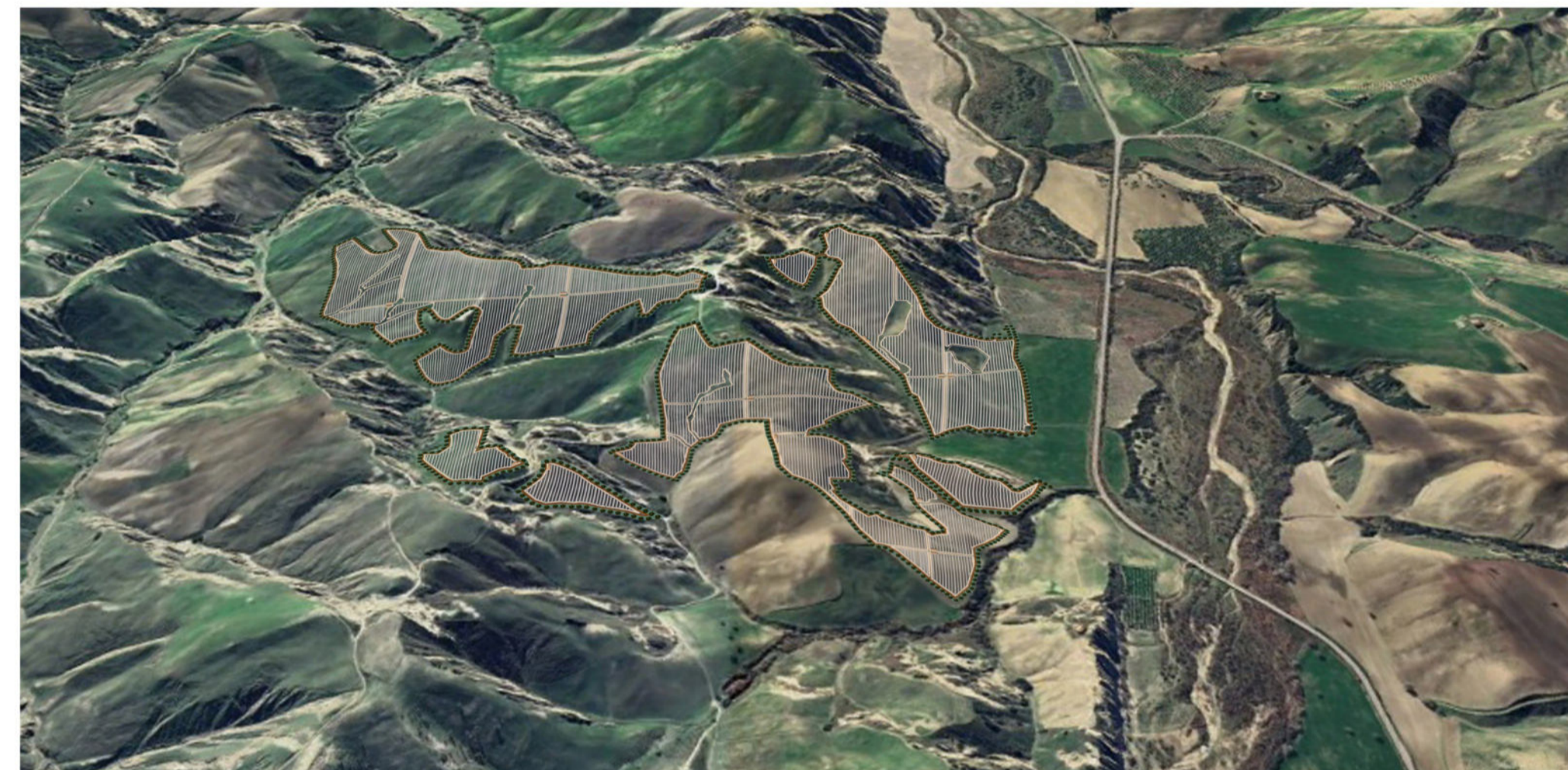
VISTA SUD - IMPIANTO LOMBONE