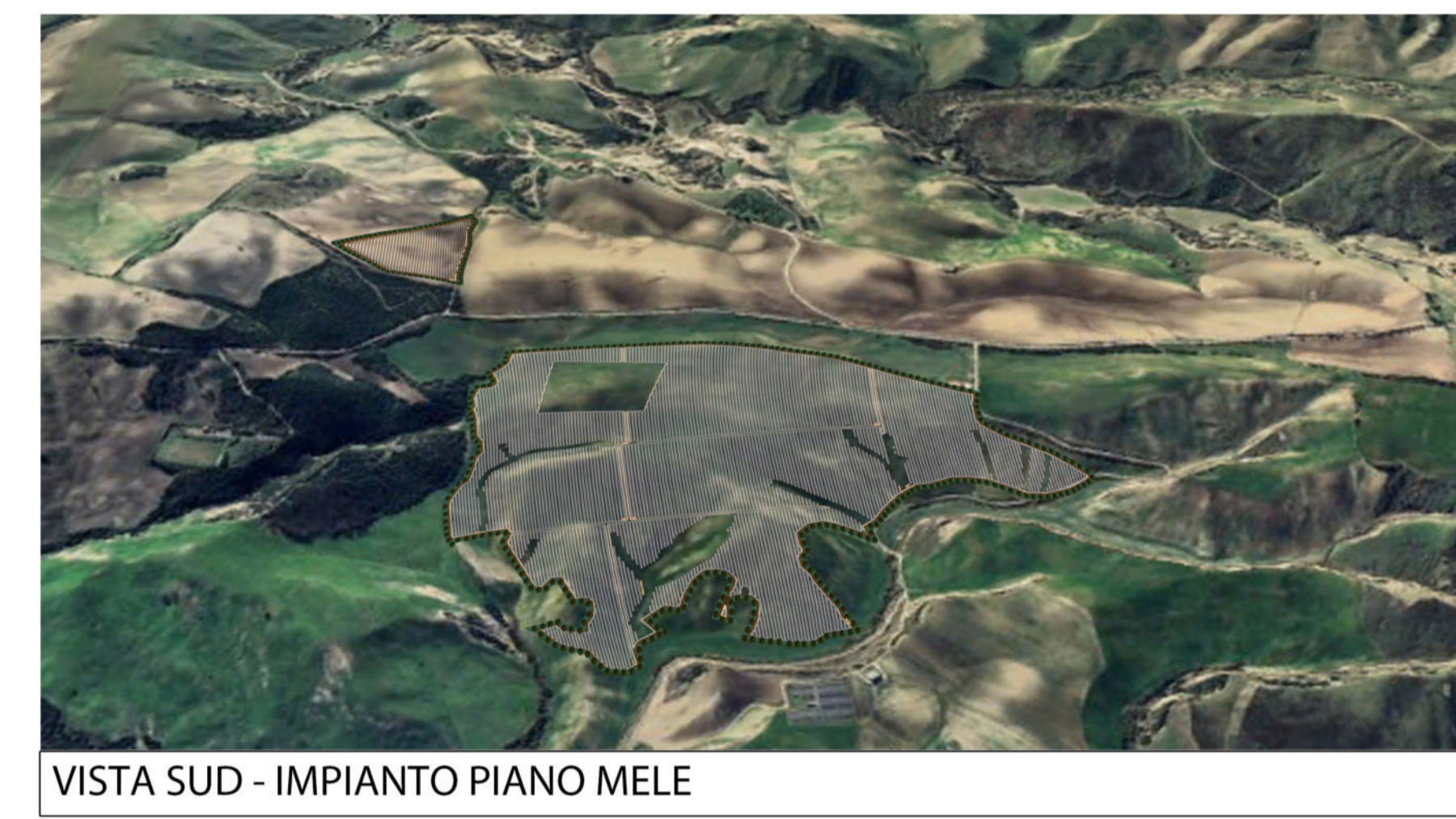
VISTA SUD - IMPIANTO PIANO MELE