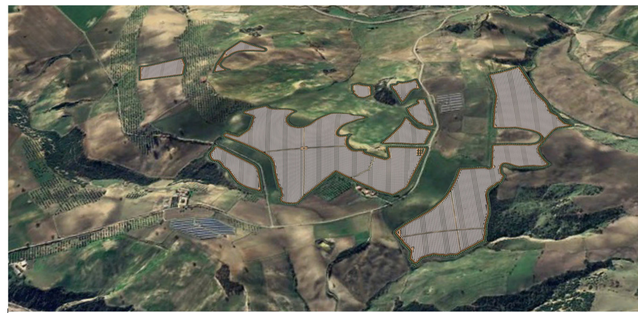
VISTA SUD - PIANO DI LINO