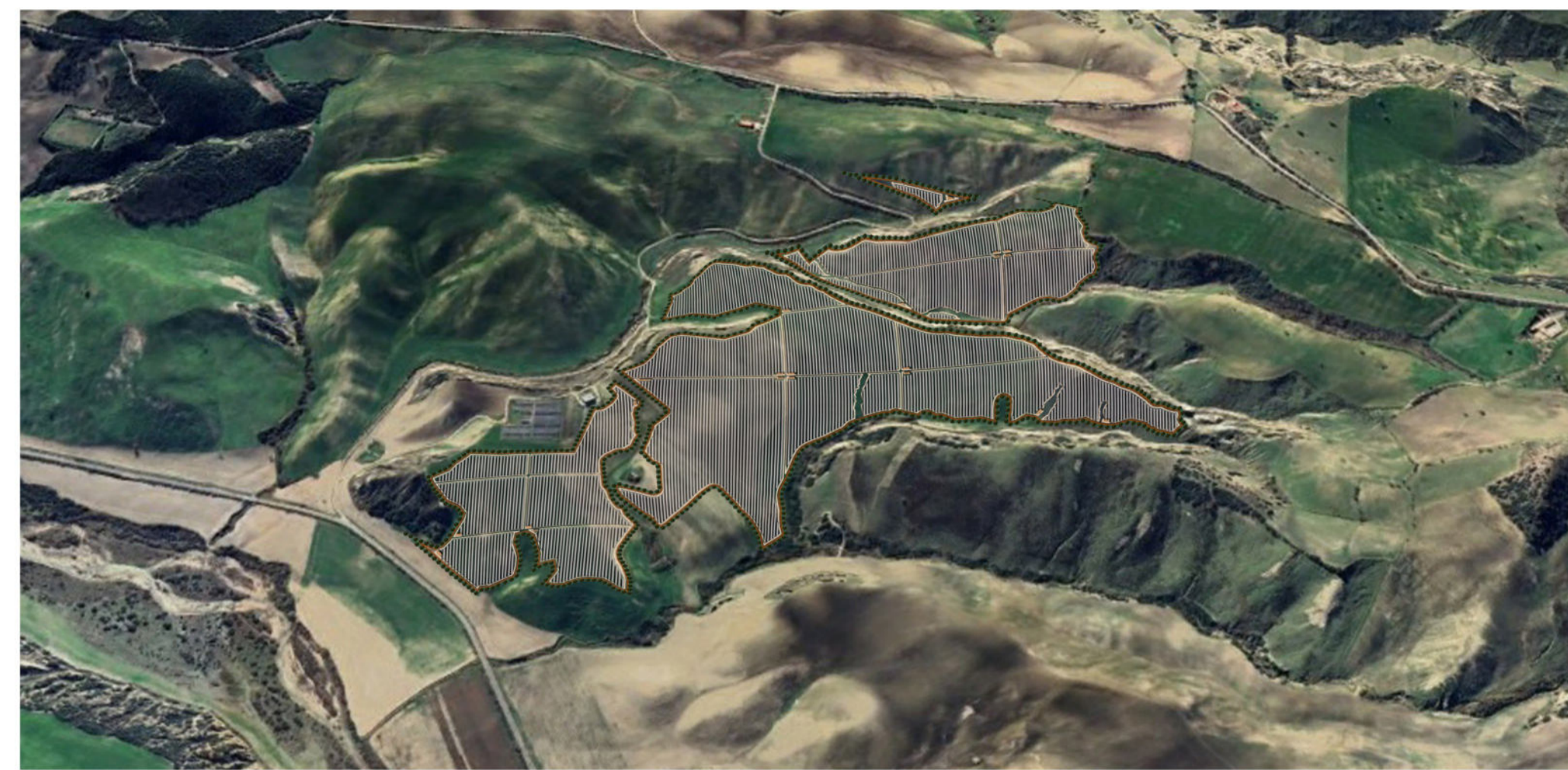
VISTA SUD - IMPIANTO F.LLI LOIUDICE