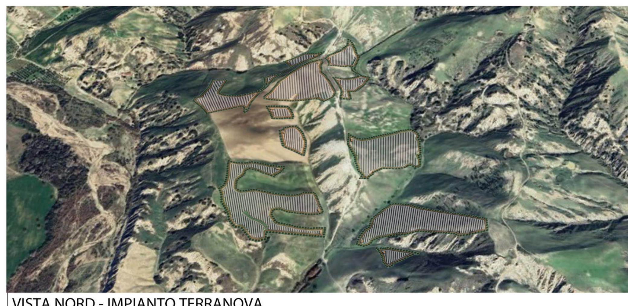
VISTA NORD - IMPIANTO TERRANOVA