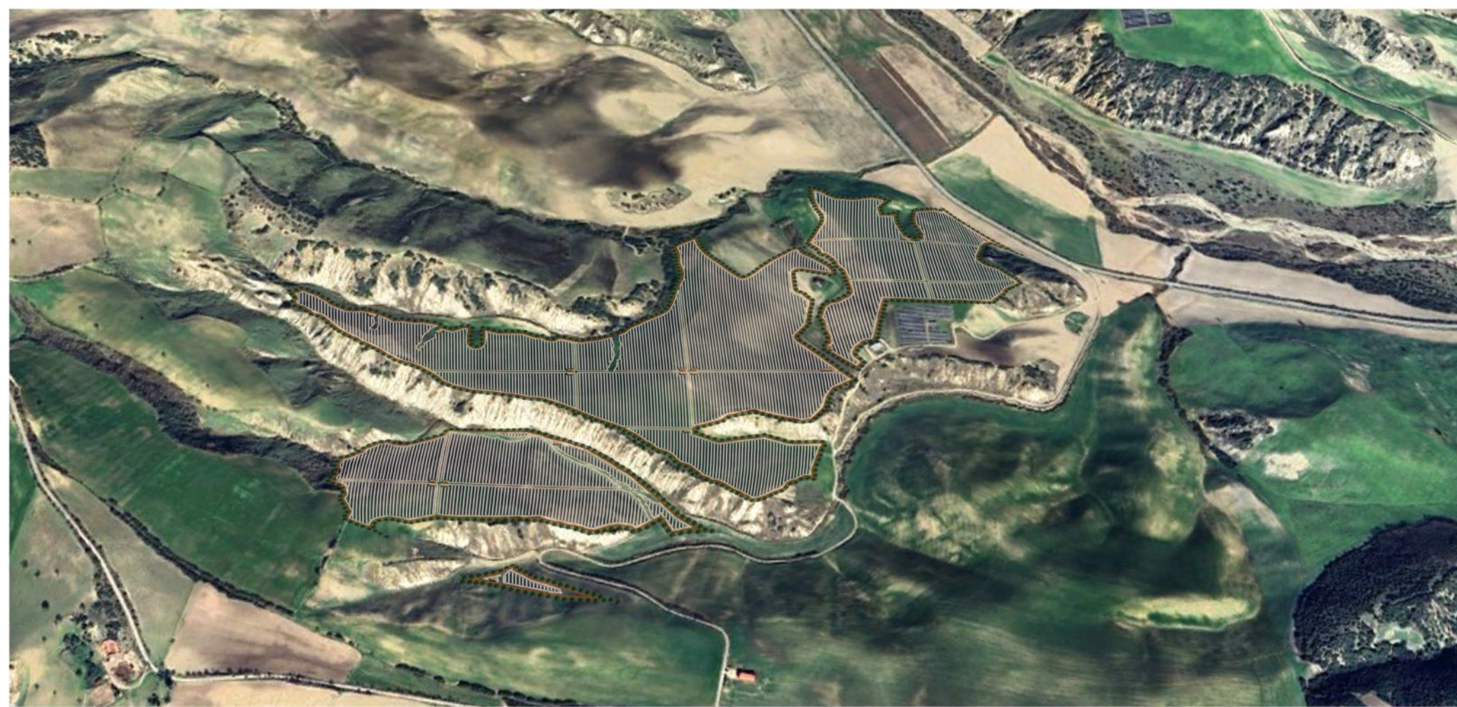
VISTA NORD - IMPIANTO F.LLI LOIUDICE