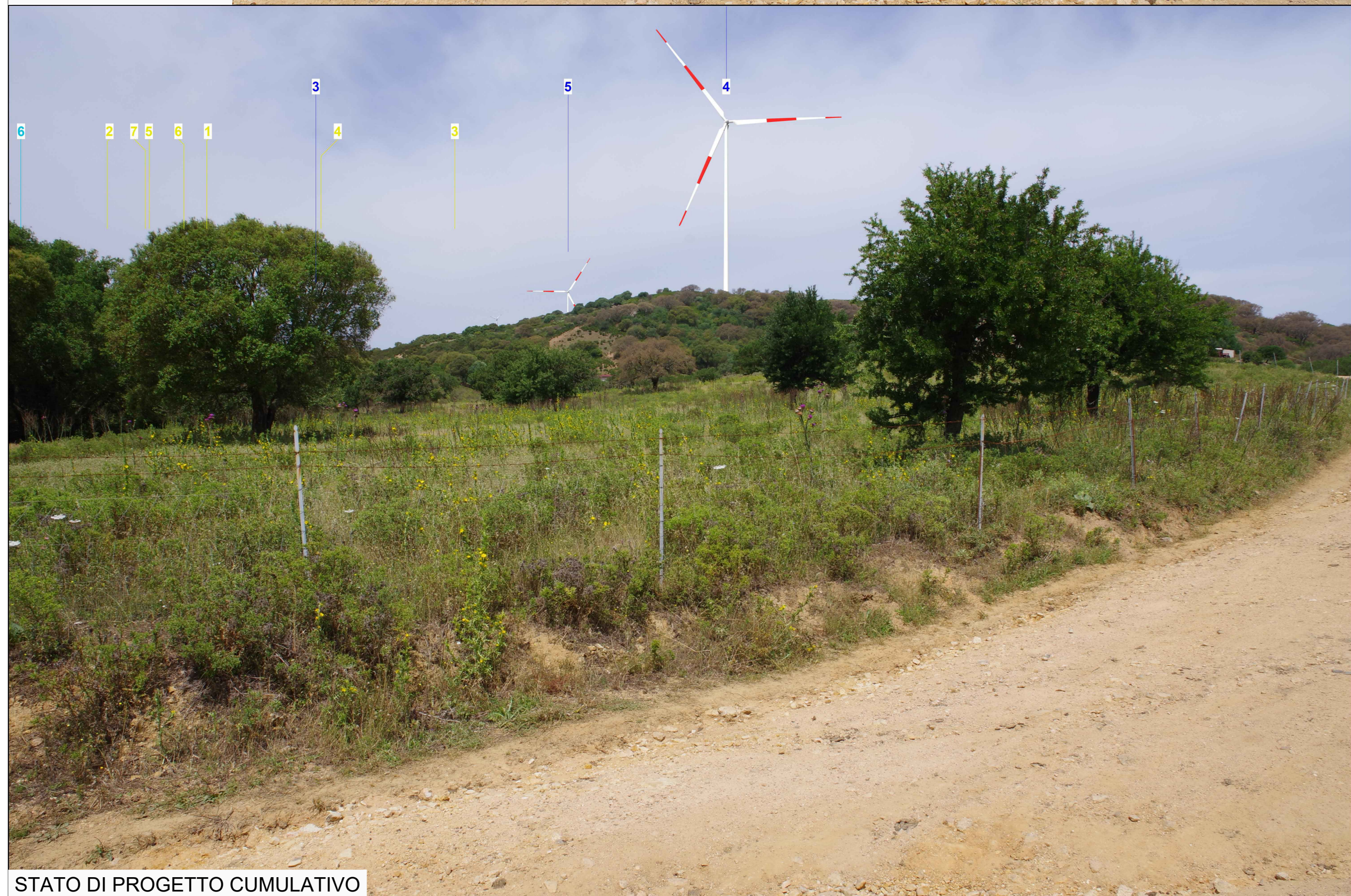
STATO DI PROGETTO CUMULATIVO