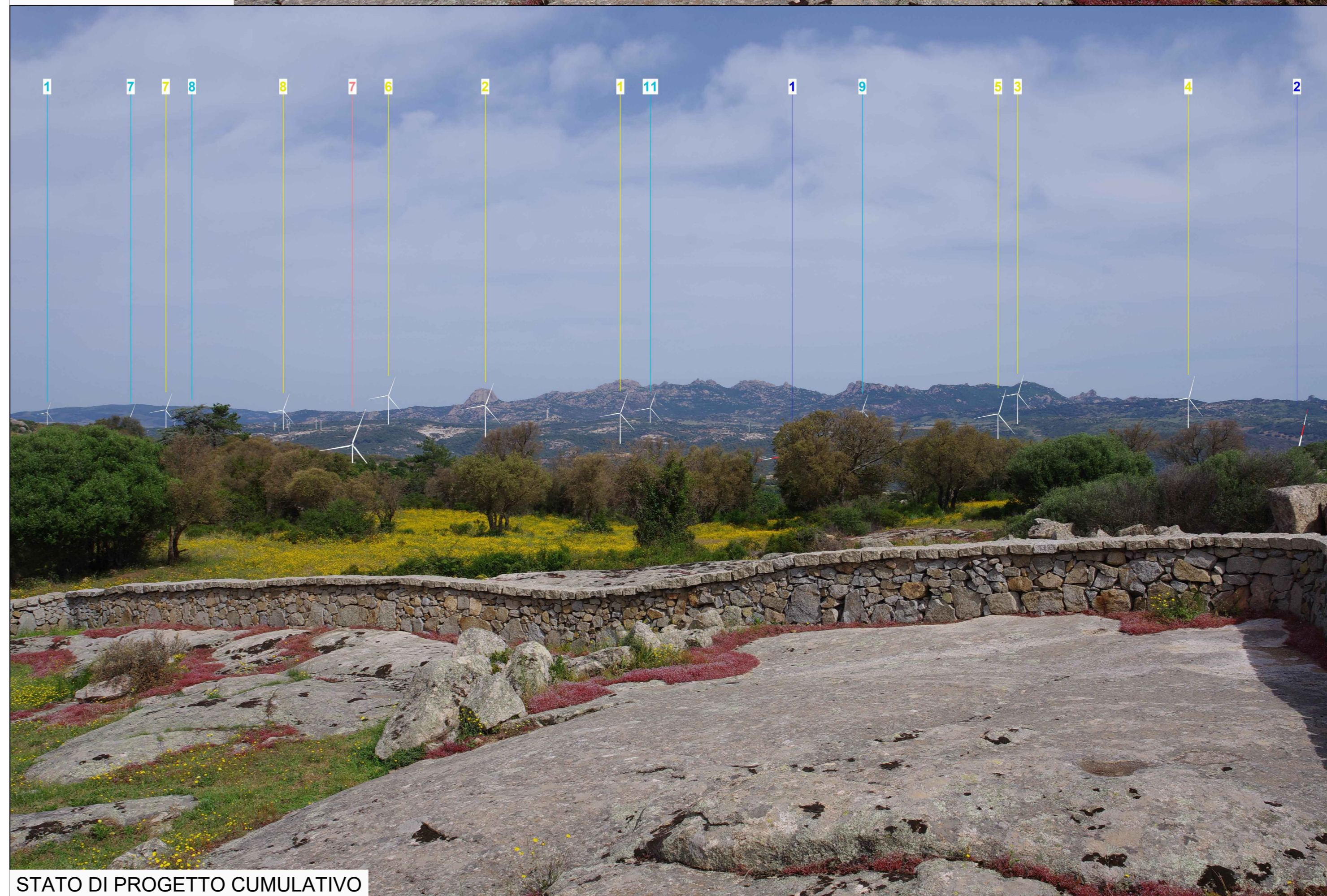
STATO DI PROGETTO CUMULATIVO